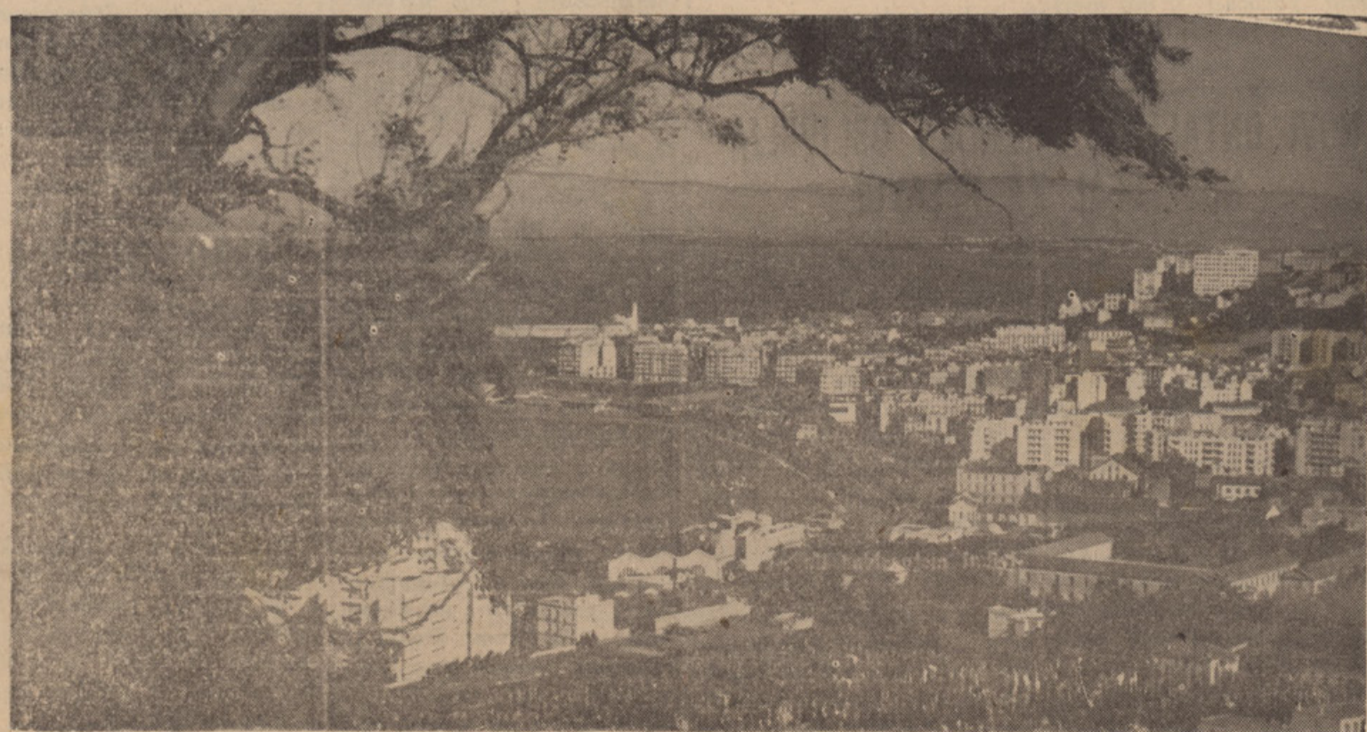
PRISTANIŠČE CASOBLANCO V AFRICI, KI GA SO AMERIŠKE ČETE ZAVZELE.