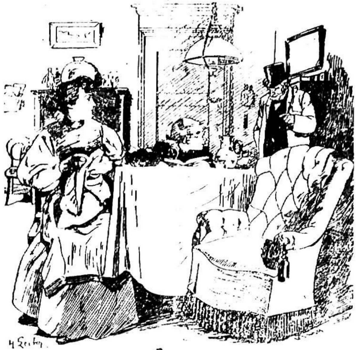
Oče prišedši domov: »Kralj mi je podaril črnega orla.« Mali Slavko: »O papa, jaz bil bolj zadovoljen, če bi ti podaril kakega lepega papagaja!«

Nocoj 8. t. m. ob 8 1/2 uri na Miklav- žev večer v „Trg. dom“ s prepasani- mi hlačami na tre- buhu, da komu od smeha ne počī.