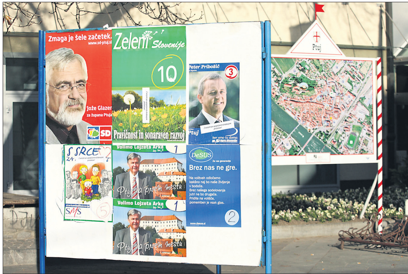
Boj za lokalne stolčke se je že pričel. (Fotografija je ilustrativna.)

Letošnje leto je volilno za lokalne funkcije - volitve županov in občinskih svetnikov. Da se nezadržno približujejo, kaže tudi povečana prisotnost nekaterih mestnih svetnikov in potencialnih kandidatov za novega župana MO Ptuj na nekaterih opaznejših prireditvah.