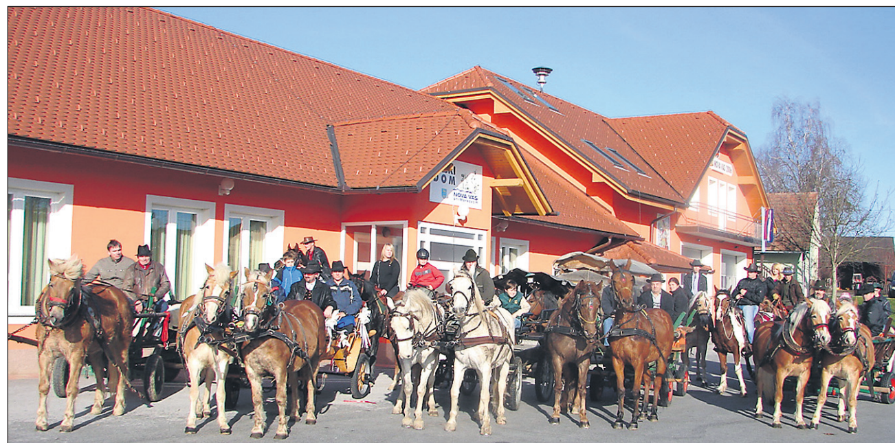
Zbrani konjeniki pred gasilsko-vaškim domom v Novi vasi