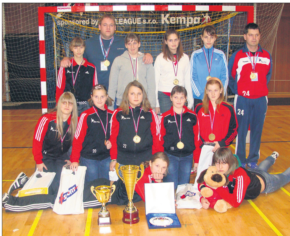
Zmagovalke turnirja na Slovaškem - ŽRK Mercator Tenzor Ptuj