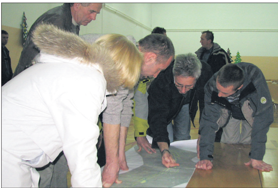
Podlehnčani, živeči na območju zaselka Nova cerkev, so po dobri uri razprave sprejeli soglasen sklep, da se predvideni nadvoz s krožiščem na vzporedni cesti proti Žetalam prestavi nekaj deset metrov bolj severno od sedanje lokacije (bližje centru Podlehnika).

Zato je takoj po novem letu sklical delni zbor občanov, na katerem je približno 30 udeležencev po dobri uri debate soglasno sprejelo odločitev, da naj se nadvoz s priključenim krožiščem na vzporedni cesti projektira na novo lokacijo, in sicer pred samim območjem zgoščene poselitve oziroma pred cerkvijo, bližje centru Podlehnika, kot je predviden sedaj. Seveda odločitev najbolj prizadetih Podlehnčanov ni