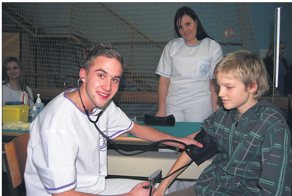
Marsikateremu dijaku je pri sprejemanju odločitve o tem, kje bo nadaljeval šolanje, pritisk narasel.

stavitvami na tržnicah poklicev, ali so že izbrali srednjo šolo, na kateri želijo nadaljevati šolanje, kaj oz. kdo jim je pomagal, kaj je vplivalo na izbiro ter ali upoštevajo tudi potrebe po poklicih na trgu dela, smo povprašali breške devetošolce.