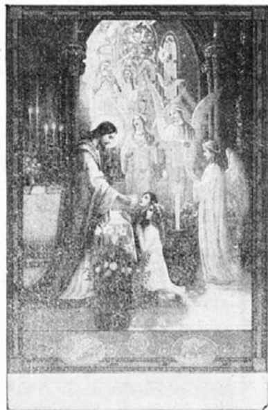
Slovesnost prvega sv. obhajila.

Da, deset nagrad! Pa lepe so, zelo lepe. Dobe jih tisti, ki bodo vsaj do 23. junija popisali slovesnost prvega svetega obhajila, pri kateri so bili navzoči bodisi kot prvoobhajanci, bodisi kot gledalci. Razume se, da bo nagrajenih le deset n a j b o l j š i h spisov. Nekaj takih spisov sem že prejel, toda le trije so res dobri. Najboljši spisi bodo priobčeni v prihodnji številki »Lučke«. Torej le korajžno na delo!