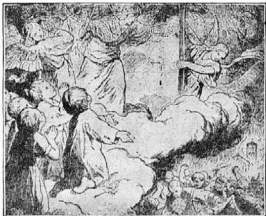
Molitve svetih otrok odprejo nebesa.

v to Bogu sovražno divjanje. Teh ubožčkov se hočemo prav posebno iskreno spominjati pri molitvi. Sveti otroci bi mogli delati prave čudeže in ukrotiti vse Jezusove sovražnike. Molitve in premagovanja svetih otrok odprejo nebesa in zaprejo peklena vrata. Otroci! Po »Jezusovih dnevih« boste postali sveti