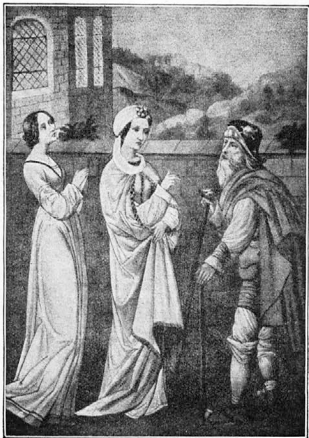
Sv. Elizabeta, tolažnica ubožcev.