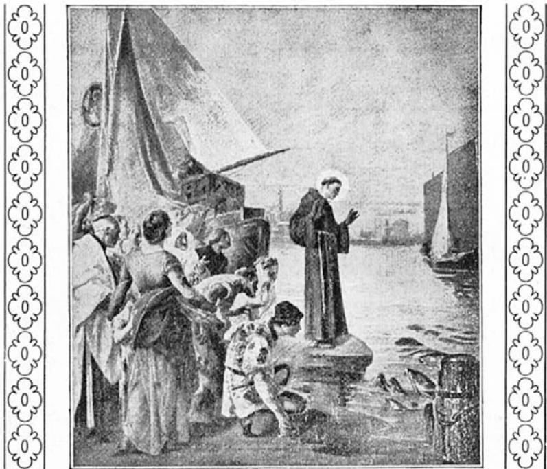
Sv. Anton pridiguje ribam.

je priplavala taka množica velikih, malih in srednjih rib k bregu, kakor jih toliko še nikdar ni bilo videti ne v morju, ne v reki. Vse so molele glavo iznad vode in se mirno razvrstile pred svetnikom ter pazno motrile njegov obraz. Spredaj tik brega so se postavile male ribice, za njimi srednje in za temi, kjer je bila voda globokejša, so stale velike ribe.