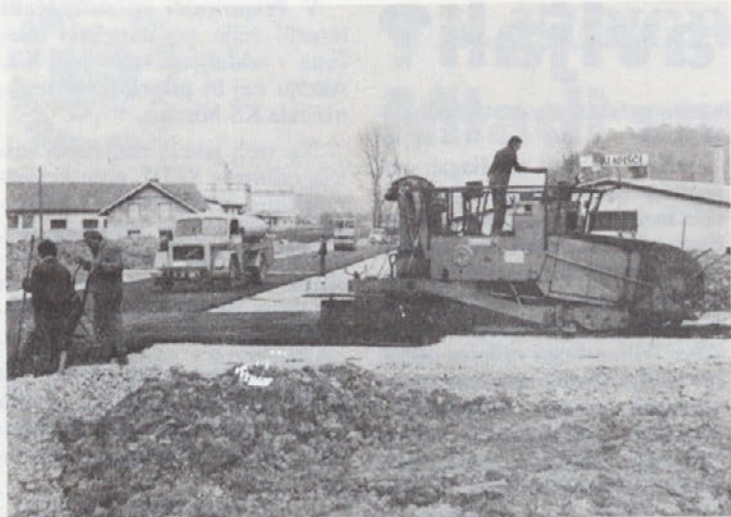
Dela na delu bodoče mirenske obvoznice so že končana.