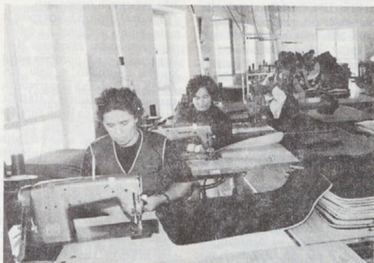
Šivalnica v TOZD IMV na Mirni

sporazuma o razporeditvi sredstev, pravic in obveznosti med TOZD, združenih v DO IMV Novo mesto.