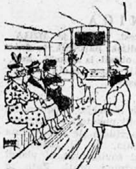
»Pogovarjanje z vozačem prepovedano!«