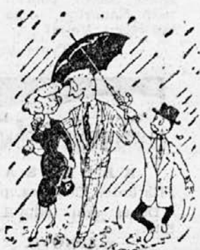
»Dovolite, gospodična, da sprejmeva ljubezljivo ponudbo tega simpatičnega gospoda!«