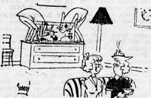
»No, ta dva sta pa že spet pri spomlnih iz potapljaških časov!«