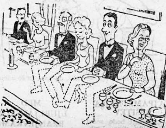
Ce bi bila miza prozorna...