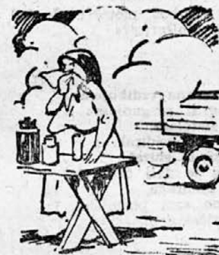
... in prah v mleku!