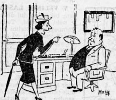
»In da mi nikoli ne vzameš tajnice na kolena!«