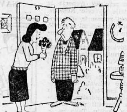
»Oh, kako so ljubke! — Ali si bil v parku?«