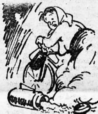
Mleko v prahu...