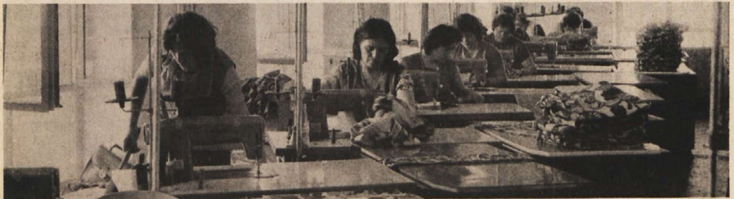
Takole teče delo v šivalnici za izdelovanje prevlek v TOZD tovarna opreme na Mirni

„Za zaposlene žene bi bilo potrebno, da se čim manj vključujejo v nadurno delo. Prav tako naj bi ne delale v nočni izmeni. V avtomobilski proizvodnji bi bilo potrebno urediti sanitarije in prostor za žene. Vprašanje je tudi urejenost garderob.“