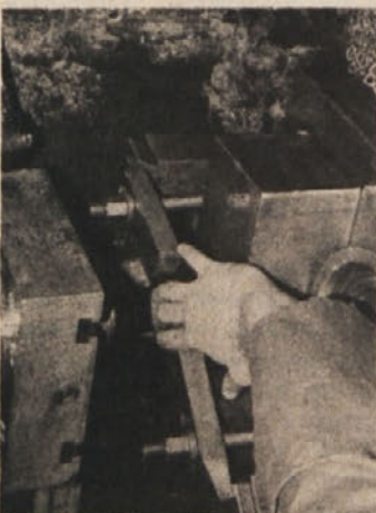
Proženje stiskalnice z eno roko: posledica — huda poškodba prstov desne roke