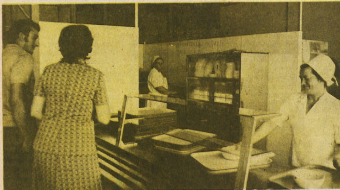
Pripravljanje okusnih in zdravih obrokov hrane je sestavni del skrbi za zdravje in delovno sposobnost naših delavcev. Na sliki: v brežiški menzi TOZD — IMV tovarna avtomobilskih prikolic Brežice

Po vložitvi predloga za uvedbo postopka lahko sodišče združenega dela prve stopnje po uradni dolžnosti ali na predlog katerega izmed udeležencev odredi enega ali več začasnih ukrepov, za katere glede na okoliščine posameznega primera meni, da so potrebni, ker lahko preprečijo oz. odvrnejo samovoljno ravnanje, s katerim