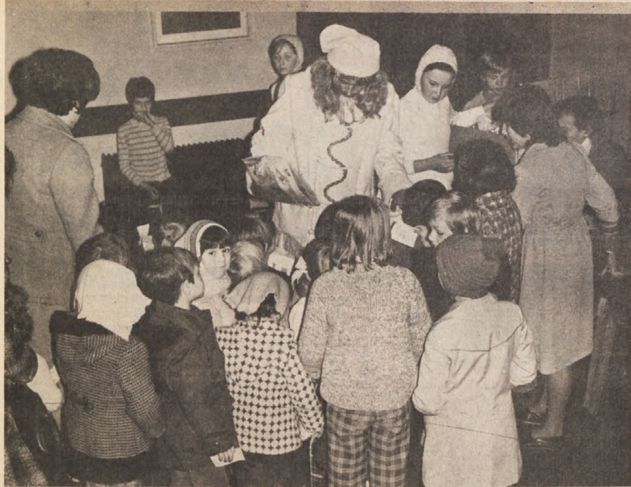
Ob novem letu, kot je že običaj v Industriji motornih vozil, smo obdarili naše najmlajše. Za otroke delavcev, zaposlenih v TOZD s sedežem v Novem mestu, ki so to želeli, smo organizirali v osnovni šoli Grm kulturni program s prihodom Dedka Mrza. Lutkovna skupina šole je prikazala igrico „Kriček in Pikec“. Po končani igrici je prišel Dedek Mraz, razdelil darila, nakar so naši malčki prikazali, kaj so se naučili v vrtcih, pri starših, babicah in dedkih doma. Otroci so se zadovoljni vračali na svoje domove z željo da bi jih tudi prihodnje leto tako razveselil Dedek Mraz.