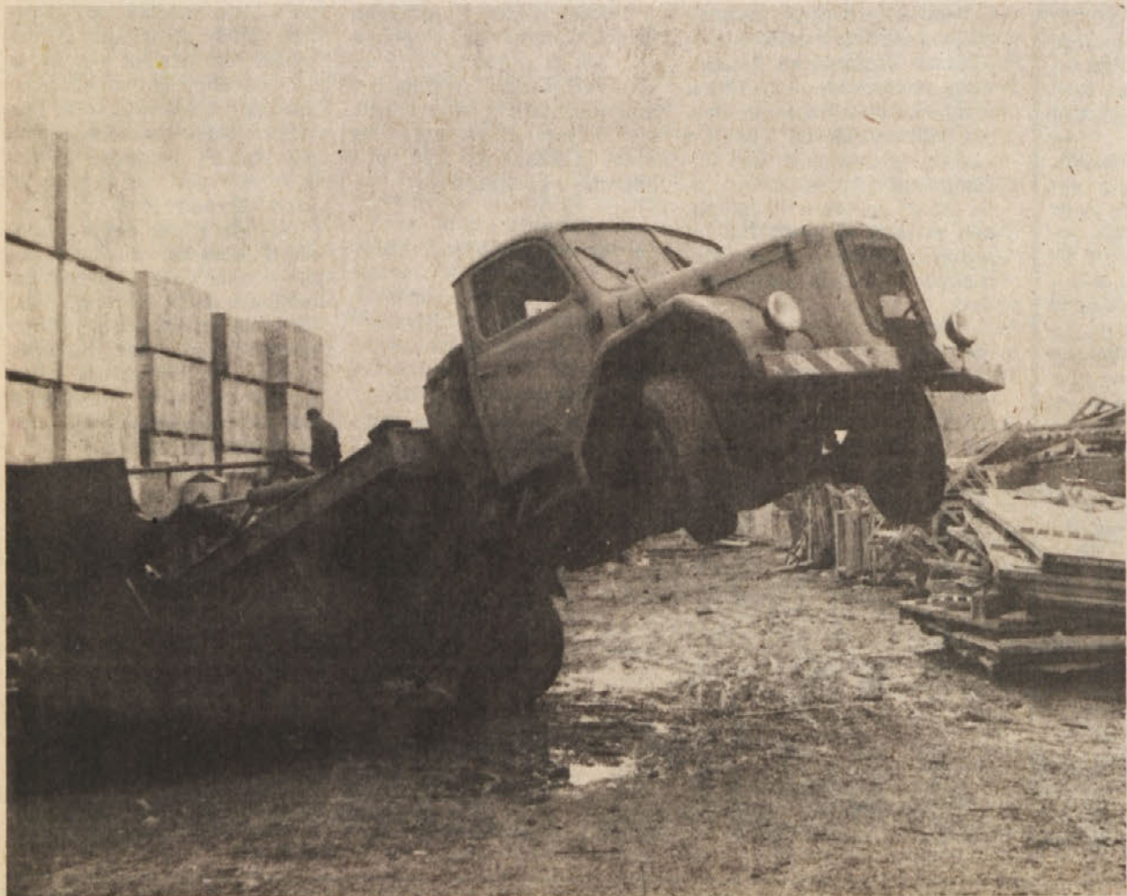
Takole se je pred dnevi „mučil“ Dinosov tovornjak, da bi odpeljal tisto, kar pri nas imenujemo „odpadni material“.

Od 20. do 29. decembra 1975 je bila v okvirih tradicionalnega novoletnega zagrebškega velesajma odprta tudi razstava „Niki Lauda vam predstavlja najhitrejše avtomobile sveta“.