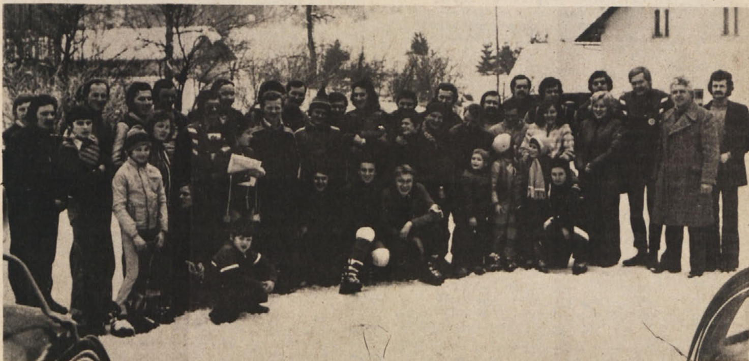
Takole nas je 22. februarja ujel še fotografov aparat za spomin na oživljeno smučarsko tekmovanje – če ne bo zadrege s snegom, se bomo tudi v Črmošnjicah še večkrat srečali!