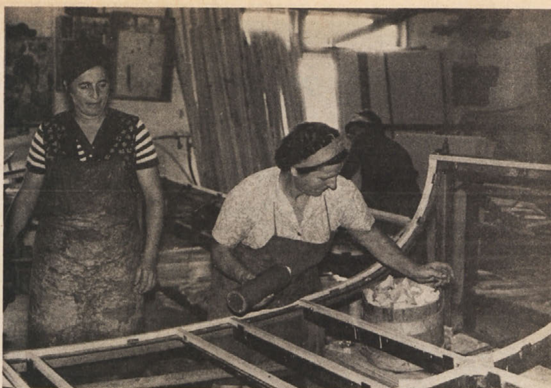
Delavke v suhorskem obratu IMV — tudi brez njih ne bi bilo naših končnih izdelkov. Petino vseh zaposlenih v IMV sestavlja več kot tisoč žensk v vseh TOZD; od te petine je še kako odvisen uspeh celotne delovne organizacije