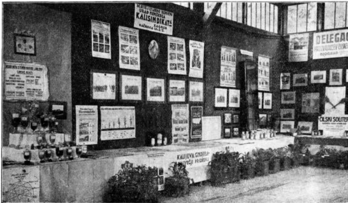
Pod. 67. Razstava tvornic za umetna gnojila.