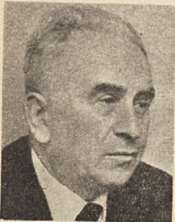
Tovariš LUIGI LONGO generalni sekretar KPI

Generalni sekretar KPI tovariš Luigi Longo je v intervjuju, ki ga je objavil tednik „Espresso“, obrazložil stališča Komunistične partije Italije do nekaterih važnih mednarodnih in italijanskih vprašanj. V zvezi s sedanji spori med KP Sovjetske zveze in kitajskimi