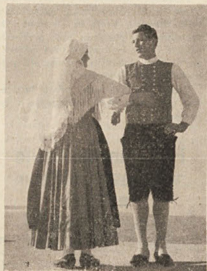
Dva člana folklorne skupine Portorož-Piran. Ta skupina je nastopila na letošnjem festivalu «l'Unità» v Trstu in na prazniku komunističnega tiska v Terzo d'Aquileja. Na obeh prireditvah je bila topla sprejeta