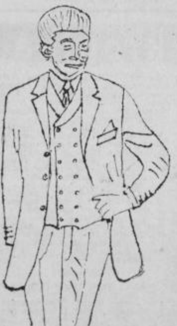
Dvojno zapenjanje s šal ovratnikom

Da ne bo govora le o ženski modi, zapišimo še nekaj za moške. Modni detajl, ki je skoraj nujen dodatek k moški obleki, elegantno