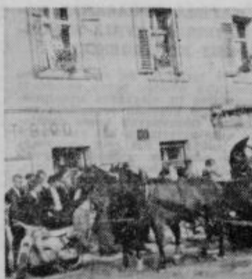
Prleška bratva 67 v Ljutomeru

zen praznih miz in nekaj jeznih turistov z izrazi na licih »vsak gre samo enkrat na led« ter točilne mize s kranjskimi klobasami, niso našli ničesar. Po eni uri čakanja, se je pričela skromna povorka po ljutomerskih ulicah s tremi okrašenimi vozovi, ki so le deloma prikazovali prleške običaje ob času trgovat. Na Glavnem trgu se je povorka ustavila, ansambel Zibrat pa je gostolen, kj so bili zaradi navedenega (Konec je na 4. strani)