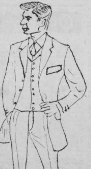
Dvojno zapenjanje z clastično fazono

Fazona — lahko je padajoča klasična, visoko ali nizko zaprta, šal ali okrogel ovratnik — še vedno pa je v modi navaden izrez »V«, torej brez ovratnika.