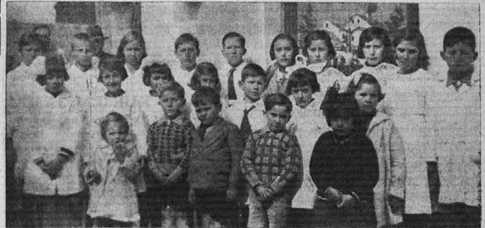
Skupina šolarjev, ki posejajo tečaje za poučevanje materinščine v Villi Devoto. Podobna šola ob stoji tudi na Paternalu.

vori se, da so italijanske politične oblasti, v zvezi z bližnjim spopadom z Abesinijo, precej pozorne na vojaštvo in oficirje, ki je nasprotno temu početju in ki je s tem postalo sumljivo. Tako so pred kratkim policijske oblasti izvršile obsežne preiskave na stanovanjih vseh oficirjev v Ilirski Bistrici med časom, ko so ne ti nahajali na vajah. O podrobnem poteku in izteku ter posledicah nam ni še točno znano. Gotovo pa ne bo imelo tako nezaupanje političnih oblasti, pri vojakih bogve kako dobrih posledic.