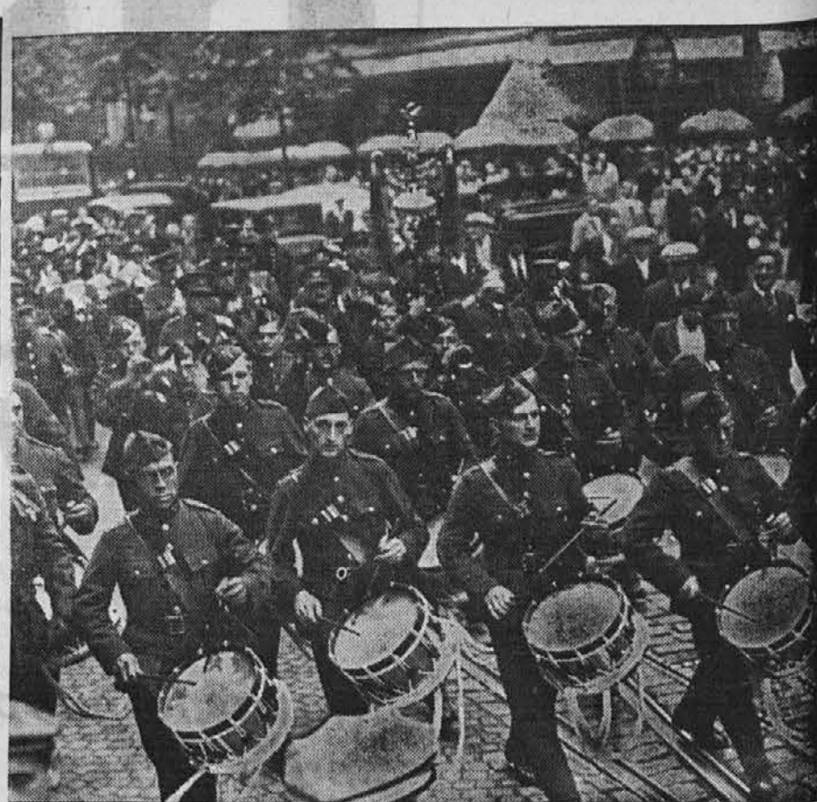
Večji oddelek belgijskih karabinerjev je pred nedavnim posetil Pariz