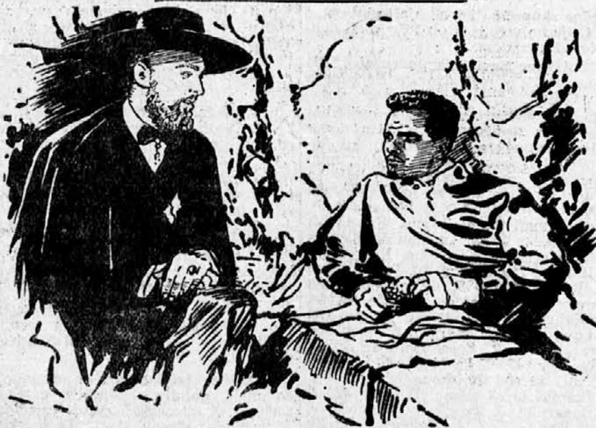
PRIZOR IZ FILMA »JUAREZ«, NAJV EČJEGA DELA LETOŠNJE AMERIŠKE FILMSKE PROIZVODNJE

Toda, nekega dne, ko je strežnica prestopila hišni prag, je prejela krepko zaušnico gospodinje. Ta je zvedela za muhe hišnih gospodov in se je maščevala nad dekletom, prepričana, da je rafinirana zvodnica. Dekle, ki je bilo na stvari res nedolžno, se je pritožilo na policiji.