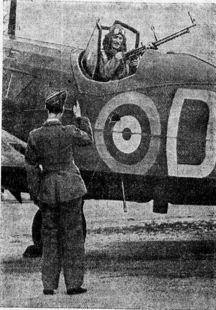
Zadnja navodila pred startom na izvidnico.

Sviciarski listi pišejo o razmerju sil vojujočih se držav v zraku in pravijo, da sta Francija in Anglija v začetku l. 1938, imele komaj polovico toliko letal kakor Nemčija. Lani je bilo proizvedeno v Franciji več letal, kakor vsa štiri leta poprej. Še v septembru je bila Nemčija v zraku močnejša kakor obe zahodni državi. Po vojni napovedi se je začelo mrzlično oboroževanje. Italijanski list »Popolo d'Italia« meni, da imajo Nemčija, Francija in Anglija skupaj 30.000 letal. Od teh odpade na Nemčijo 16.400 letal. Številčno, pravi list, nemška premoč ni znatna, toda treba je upoštevati, da so zračne sile zahodnih velesil raztresene tudi drugod, dočim jih ima Nemčija skupaj. Podcenjevati se pa ne sme trajni dovoz letal iz Amerike. Anglija in Francija bosta samo letos dobili iz USA