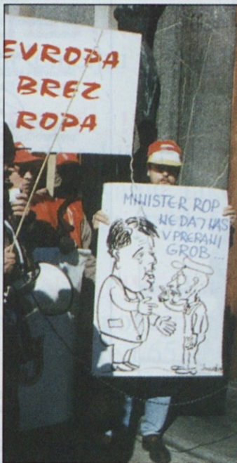
Glavna tarča na transparentih je bil minister Tone Rop.