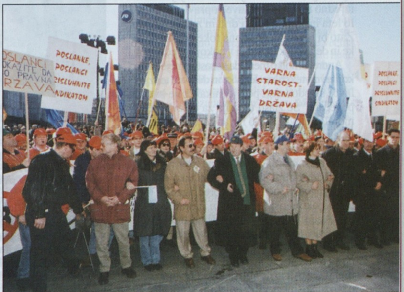
Verigo so začeli predsedniki sindikatov.