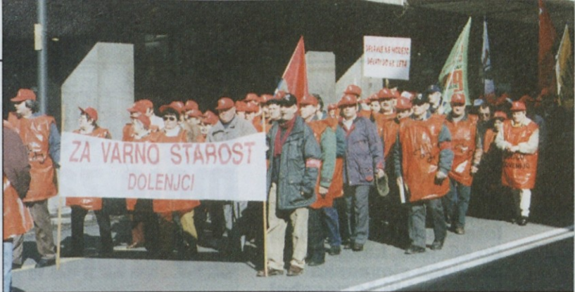
Dolenjci gredo mimo Name.

Danes gremo pred parlament zato, ker nas vlada, kjer smo že bili, ni poslušala. Od poslancev bomo zahtevali, naj zakon vrnejo ekonomsko-socialnemu svetu. Če nas politika ne bo upoštevala, ji res ni pomoči.