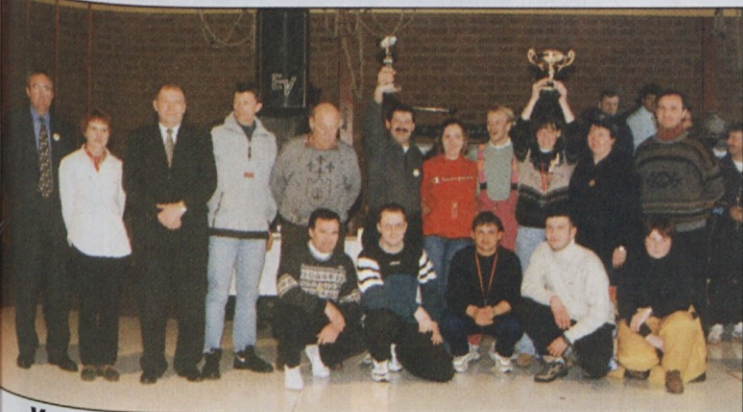
V ekipni razvrstitvi so bili najboljši domačini iz Preventa, za njimi sta bili ekipi Monta Kozje in BPT Tržič.