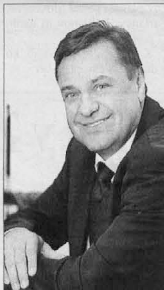
Il sindaco di Lubiana Zoran Janković

dei Governi nazionali, della reciproca volontà di instaurare nuovi rapporti all'insegna del rispetto e della convivenza, rimuovendo - ha detto - difficoltà inutili e superflue.