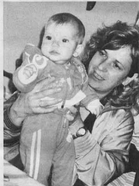
vesela pride reč, de je močna žena, pa je tudi ries, de vsa družina lepuo skarbi za njo.