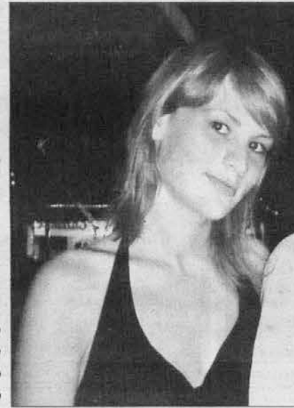
Pranavuoda Petra, navuoda od hčere Giuliane taz Meline