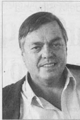
La copertina del libro e, sopra, Drago Jančar