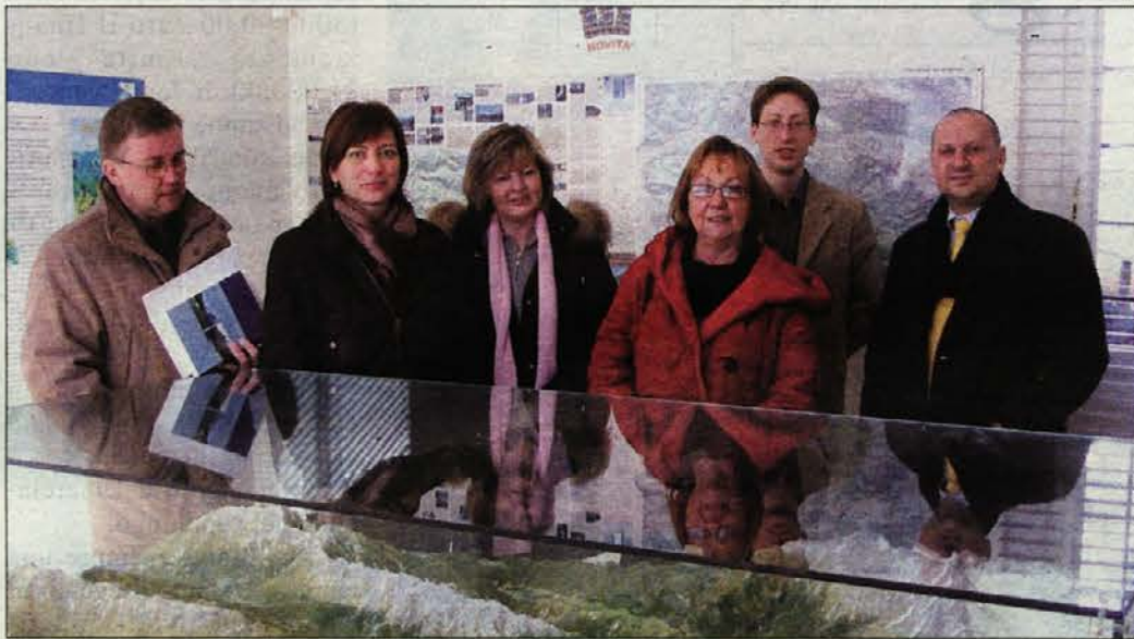
I rappresentanti dell'Istituto per la cultura slovena in visita sabato scorso al Parco delle Prealpi Giulie a Prato di Resia

Ostaja pa odprto vprašanje, kdo ima korist pihati na ogenj in ima tak vpliv na rimsko vlado: