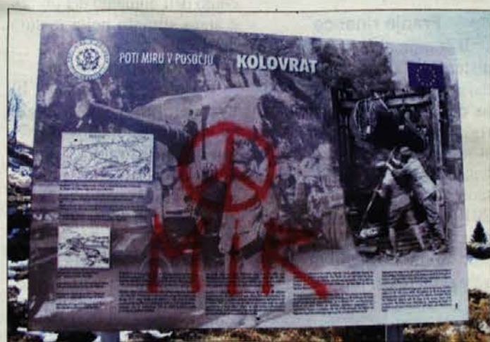
Gardo an amazano dejanje na Kolovratu. Beri na strani 6

Postaja Topolove_Projekt Koderjana Stazione di Topolò_Progetto Koderjana