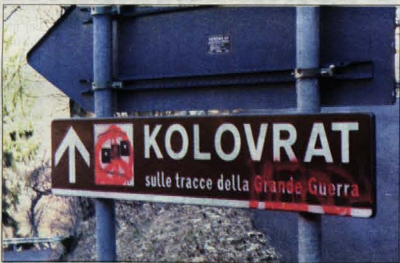
Nestropnost an sovraštvu na diele

V nedeljo so obiskovalci na Kolovratu, ki jih je nimar vic se posebno, kadar je jasno an sončno vreme, usafal tolo gardo presenečenje zaradi umazanega, hudobnega an namnega dejanja.