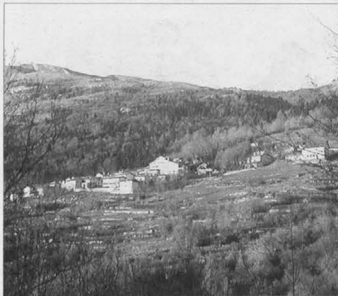
Veduta di Masseris

5,5 milioni di euro verranno erogati subito (500 mila per l'anno 2009 e 5 milioni per il 2010) ed andranno ad aggiungersi a 30