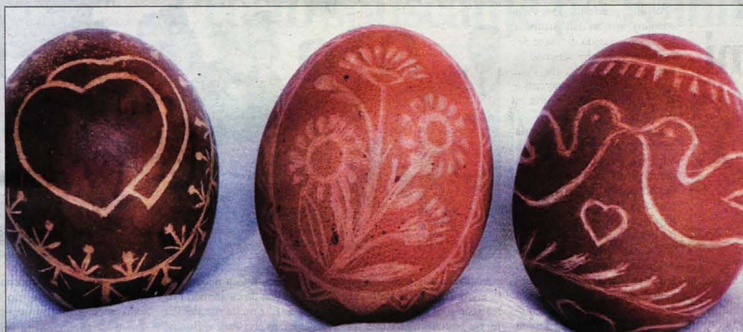
Tle blizu pisane Pierhe po stari dreški (an ne samuo) navadi an liep pogled na Kolovrat an dreške vasi