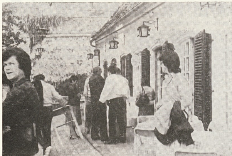
Pred ptujskim gradom

Ob ogledu grajskih znamenitosti se je verjetno marsikomu v mislih prikazala slika življenja nekdanjih graščakov. Grad je namreč iz 13. stoletja, kasneje pa so ga obnavljali. Zadnji lastniki so odšli z gradu šele leta 1946. Na vrsto je prišel za vse udeležence izleta tudi najbolj veseli del. Odpeljali smo se v Ormož na kosilo. Or-