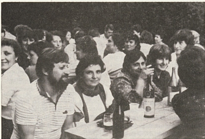
Oh, ta šmentana harmonika

Kosilo smo imeli v hotelu v Ormožu. Žal pa se je zataknilo pri razdeljevanju kosil. Nekateri so morali čakati na kosilo debelo uro, kar je seveda povzročilo precej negotovanja. Prizadeti so bili zelo slabe