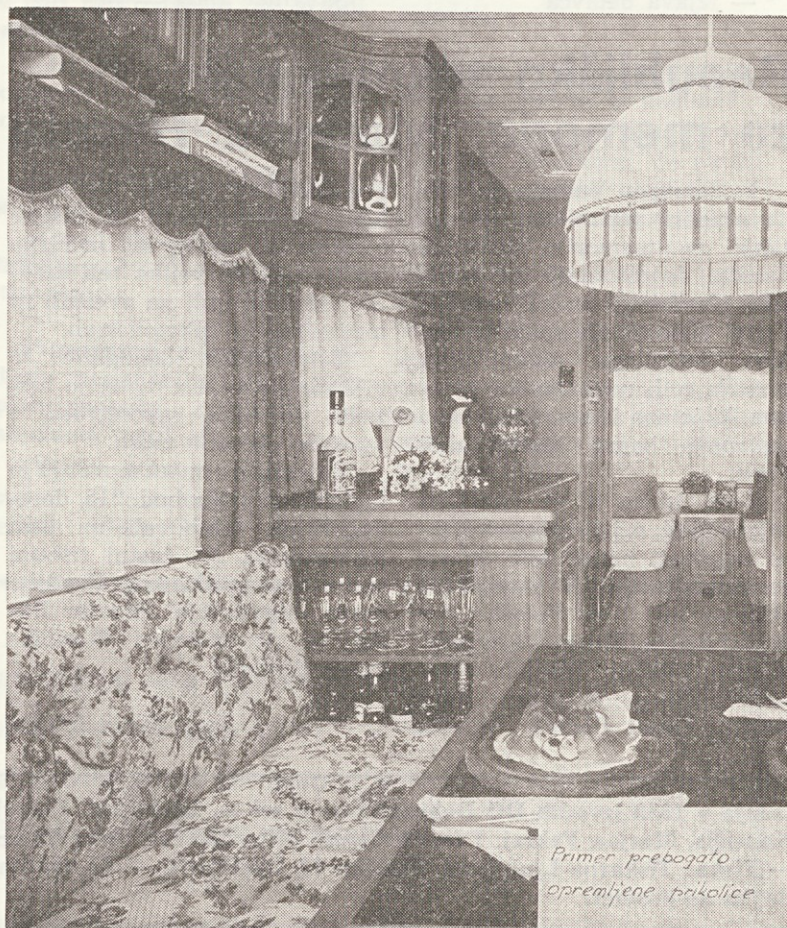
Primer prebogato opremljene prikolice