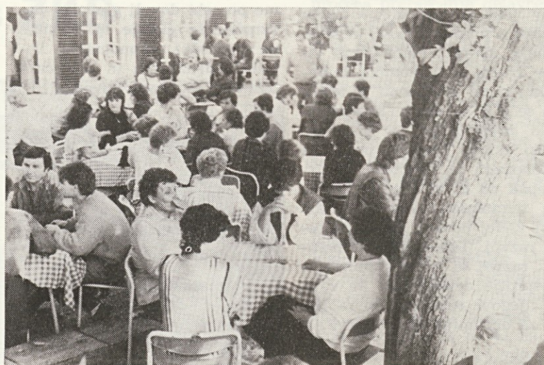
Joj, koliko nas je

Če jutro našega izleta, kakor tudi dan, vpišem iz meteorološkega vidika, moram povedati, da je bilo samo jutro megleno, iz katerega pa se je rodil lep sončen dan, kar je našemu počutju dalo še veselejši pečat.