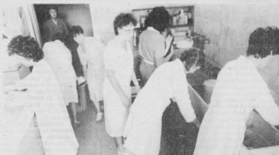
Laboratorijsko steklovino pomivajo ročno v utesnjenem prostoru, zato je nevarnost okužbe nenehna.