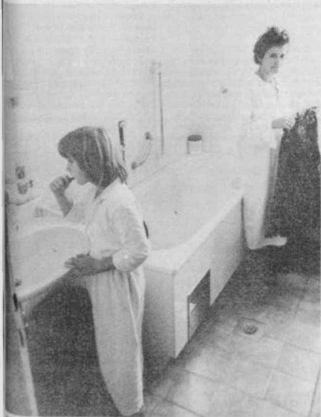
Kao nadstropje - ena kopalnica. Vrstam pred vrati se ni mogoče izogniti, prav tako ne upati na nemotenost.