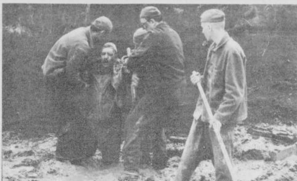
Film Hudodelci po romanu Marjana Rožanca je režiral Franci Slak.

posebnih žanrovskih sporedov, doma- la vsi filmi pa bodo imeli med TDF v Celju več rednih predstav. Torej bodo Celjani, ljubitelji filma in drugi, lahko bolje kot prejšnja leta spremljali tudi filme izven premierne sporeda, saj bodo vsi filmi »kolobarili« po večih dvoranah.