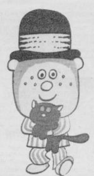
Simpatični medvedek Bo- jan bo tudi na TDF razveše- ljeval najmlajše.

Izbrani spored je izjemno kakovo- sten, da bo občinstvo videlo vse naj- boljše in najbolj zanimive letošnje ju- goslovanske filme in da spored filmov v kinih Metropol in Dom nikakor ne bi smel iti mimo občinstva.