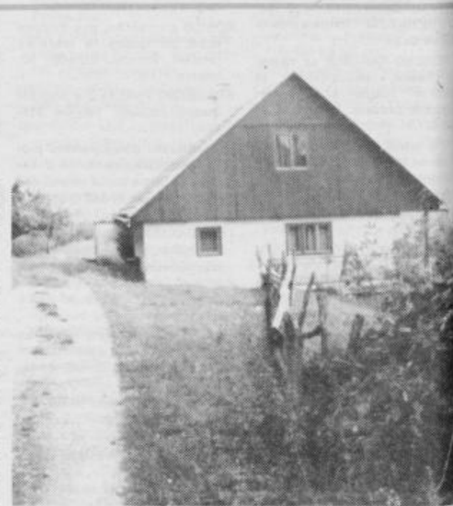
Klavžarjevo na Vetrniku.

In tako pretakajo ljudje svoje življenjske sokove skozi čas, ki ga neusmiljeno sekajo dogodki. Dobri in slabi,