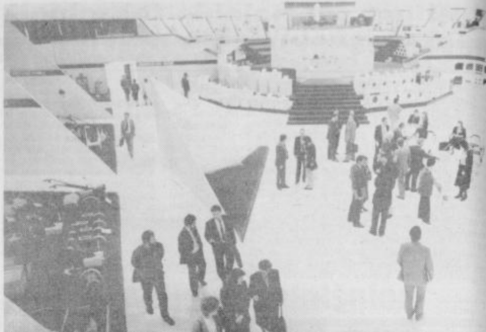
Minulo soboto in nedeljo je bil tri tisoč štiristo kvadratnih metrov obsegajoč razstaveni prostor Gorenjevega 12. hišnega sejma odprt tudi za široko javnost.