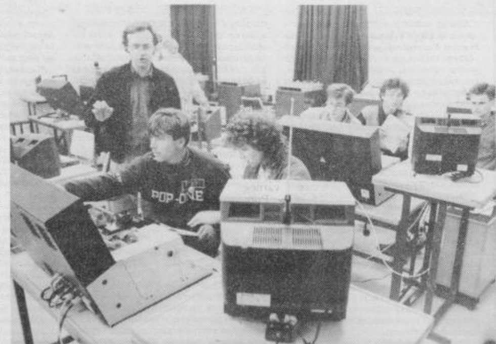
Vrzel med znanjem, pridobljenim v šoli in tistim, ki ga zahteva računalniško vodenje proizvodnje, bodo učenci Srednje tehniške šole maršala Tita zapolnili z dodatnim poukom v računalniški učilnici. Zanimanje za dodatno izobraževanje je med učenci zelo veliko, tako da je učilnica za NC in CNC tehnologijo ves čas zasedena.