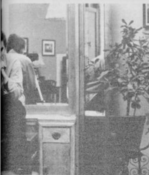
Kolak odigrala sijajno vlogo.