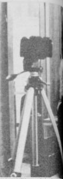
Mira Furlan je v filmu Ljubezni