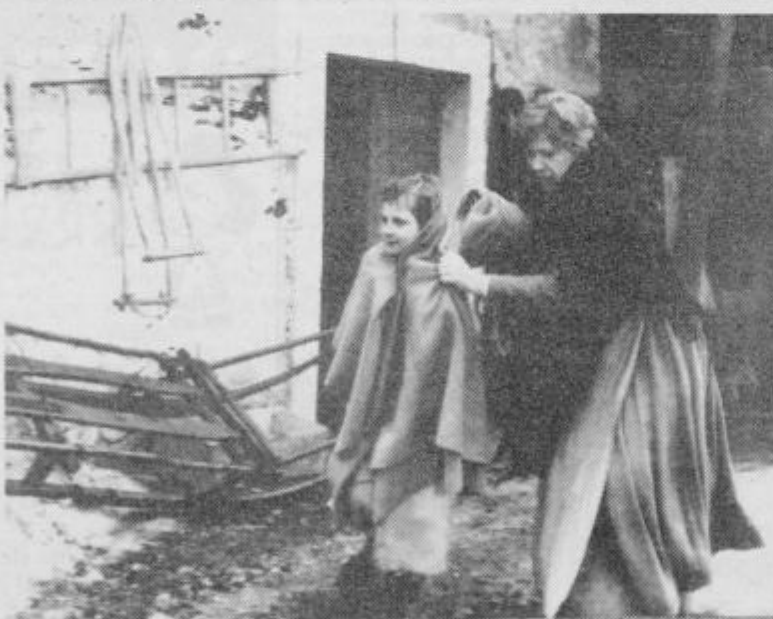
Ljubezen nam je vsem v pogubo je naslov filma, v katerem je režiser Jože Gale prepletel tri Tavčarjeve novele.

Pomembno je zapisati še, da vstopnine za to srečanje ne bo.