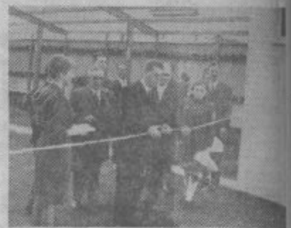
Predstavnik »Izletnika« iz Celja je prerezal vrvico in predal avtobusno postajo svojemu namenu.