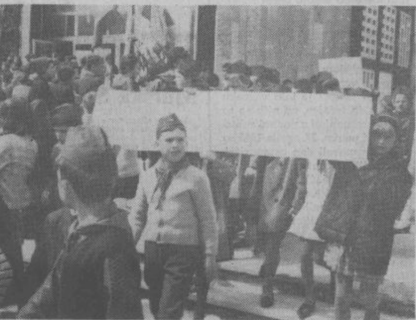
Pionirji so prišli na partizanski miting s parolami: »Mi smo Titovi — Tito je naš!«