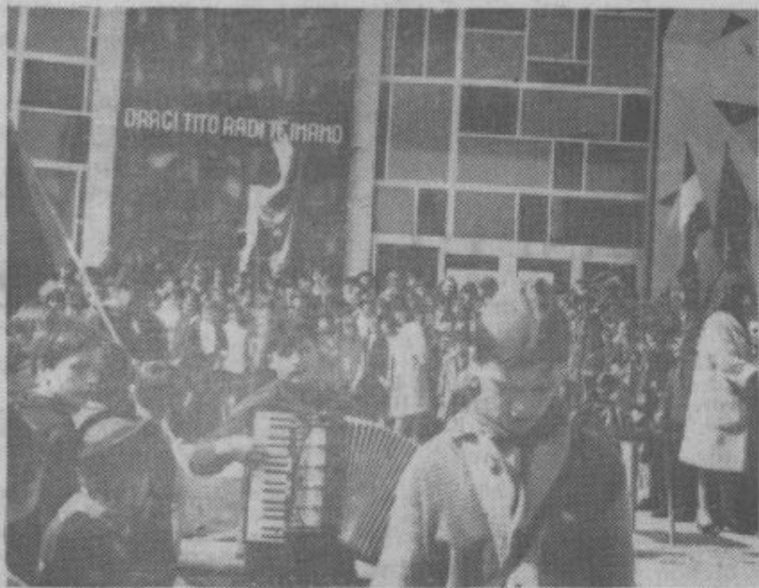
Harmonikar in pesem je spremljala pionirske patrolje, ki so nosili »kurirčkovo torbo«.