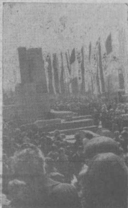
Mednarodni spomenik žrtvam v Oswiencimu.

Pred občinsko konferenco so predvideli še dve seji občinskega komiteja, na katerih bodo obravnavali med drugim tudi, kako komunisti in OO ZK uresničujejo stališča resolucije.