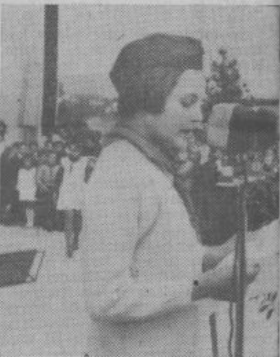
Oprosti mlada napovedovalka iz partizanskega mitinga v Velenju, da se nismo pozanimali za tvoje ime. Vsi, ki smo te poslušali pa se te dobro spominjamo, ker si tako korajžno in glasno napovedovala.