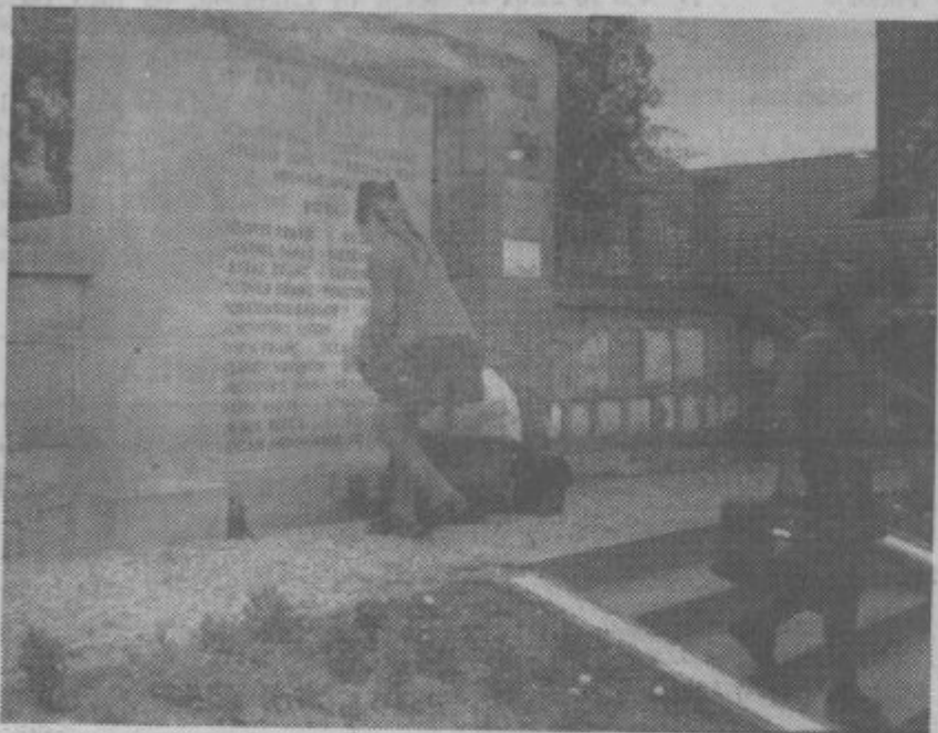
Pionirji na pohodu niso pozabili padlih borcev. Pri grobovih in spomenikih so se ustavili, prižgali svečko in se spomnili vseh žrtev, ki so darovali svoja dragocena življenja.