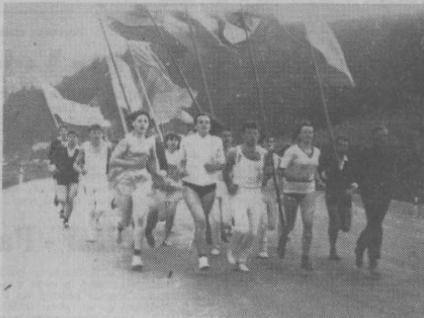
Nosilci štafetne palice na poti proti Doliču.