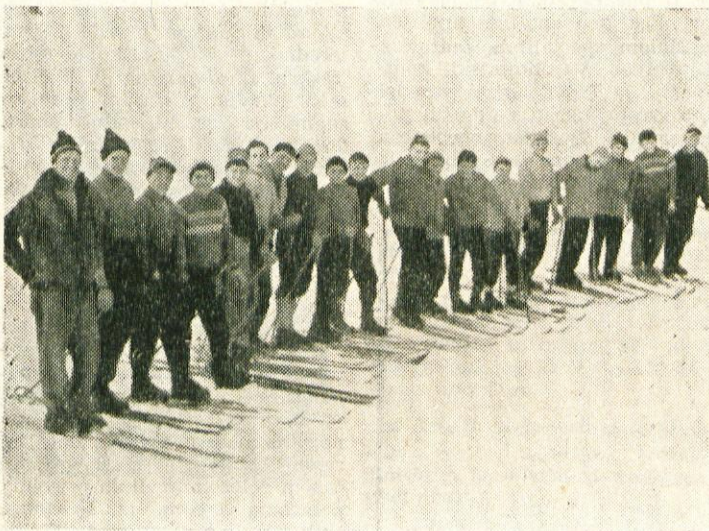
Učenci šole heroja Grajzerja na smučarskem tečaju na Kalu

Prve dni je bilo vreme lepo, potem pa sta nam meгла in dež pokvarila običajni red tako, da smo se štiri dni zadrževali kar v koči. Čas smo si krajšali z raznimi igrami, enkrat pa smo imeli veseli večer. Predzadnji dan tečaja so prišli iz Tržiča člani smučarskega kluba in nam povedali, da bo v nedeljo društveno tekmovalje v veleslalomu. Krasno vreme nam je pripomoglo, da je tekmovalje tako lepo potekalo. Po kosilu in razdelitvi nagrad smo se zadovoljni odpravili na pot proti domu.