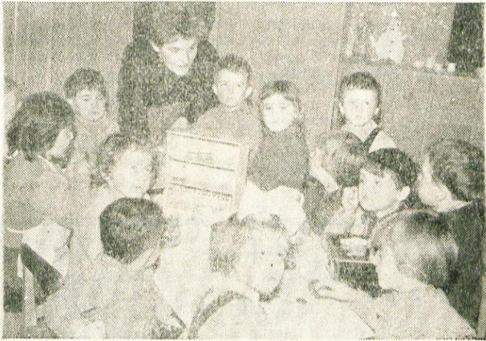
Najmlajša skupina pri učenju »kuharskih umetnosti«

Zjutraj se igrajo, kar pač kdo hoče, potem pa imajo skupne zaposlitve. Ure skupnih zaposlitvev so kratke in različne, tako da se otroci ne utrudijo. V koših sobe imajo urejene kotičke.