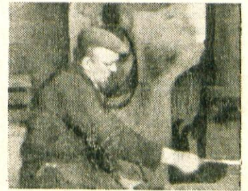
Delavec Plestenjak že več kot 20 let tanjša kose

delavcem malice po nizkih cenah in toplo črno kavo, ki jo prejemajo zastoj. Delavci na prav posebno težkih in zdravju škodljivih mestih pa dobivajo vsak dan mleko. Ker v starih prostorih ni bilo urejenih sanitarij, so zgradili lepo kopalnico, ki bo ena najlepših v mestu.