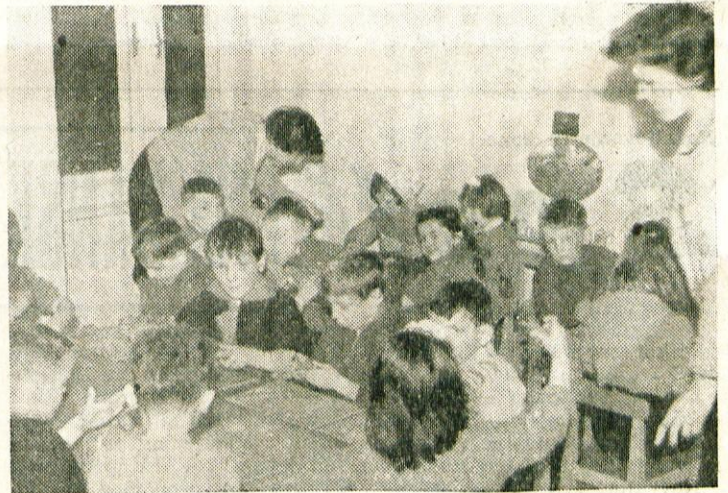
Starejša skupina oblikuje iz glin najrazličnejše figure

Imajo tehnični, glasbeni in dramski krožek. Po večerji imajo prosto, večkrat pa priredijo pogovorne večere. Uspeh gojencev dijaškega doma je bil ob polletju zelo dober. Od dvaintridesetih dijakov so imeli slabe ocene le štirje. Tovarišica Nečimerjeva jim vsak dan pregleda vse naloge in kontrolira njihovo znanje, tako da gredo vedno pripravljene v šolo. Dosedaj je bila oskrba v domu 4000 dinarjev na mesec, ker pa