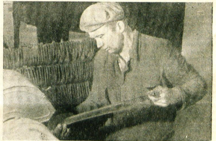
Delavec Korpič polira kose

Posnemanja vredna je pobuda delavskega sveta, da bi tiste delavce, ki vse leto ne bi imeli bolniškega dopusta, ob koncu leta posebej nagradili. Na ta na-