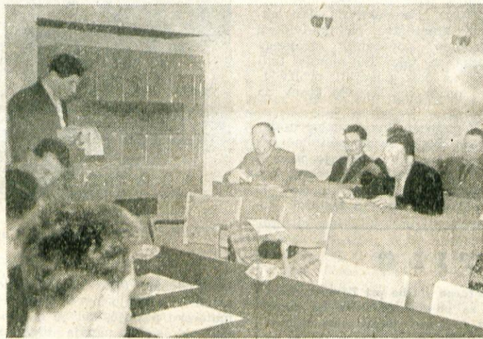
Fotoamaterji poslušajo poročilo predsednika

ljiva in zanimanje za fotografijo veliko. Predavatelji so razlagali snov na zelo dostopen način, tako da je bila vsakemu tečajniku razumljiva. Klubu primanjkuje predavateljev, primernih prostorov za praktično delo in sodobno opremljene temnice. — Vemo pa, da prav to zelo vpliva na uspehe posameznikov in kluba. Lani so pripravili člani kluba izlete, na katerih so starejši člani posredovali znanje mlajšim in še neizkušenim fotoamaterjem. Pripravili smo dve razstavi fotografij. Prva je bila aprila v počastitev tretjega kongresa Ljudske tehnike. V novembru je bila druga razstava v počastitev Dneva republike in 40. obletnice Komunistične partije Jugoslavije in SKOJ. To je bila klubska razstava, na kateri so razstavljali mlajši in starejši člani našega kluba. Vse slike so bile delo naših amaterjev. Sodelovali so tudi pionirji, ki so s svojimi lepimi slikami dokazali, da bodo dobri nasledniki starejših. Slike je izbrala in ocenila posebna komisija, ki je najboljšim amaterjem za uspele posnetke podelila nagrade in diplome.