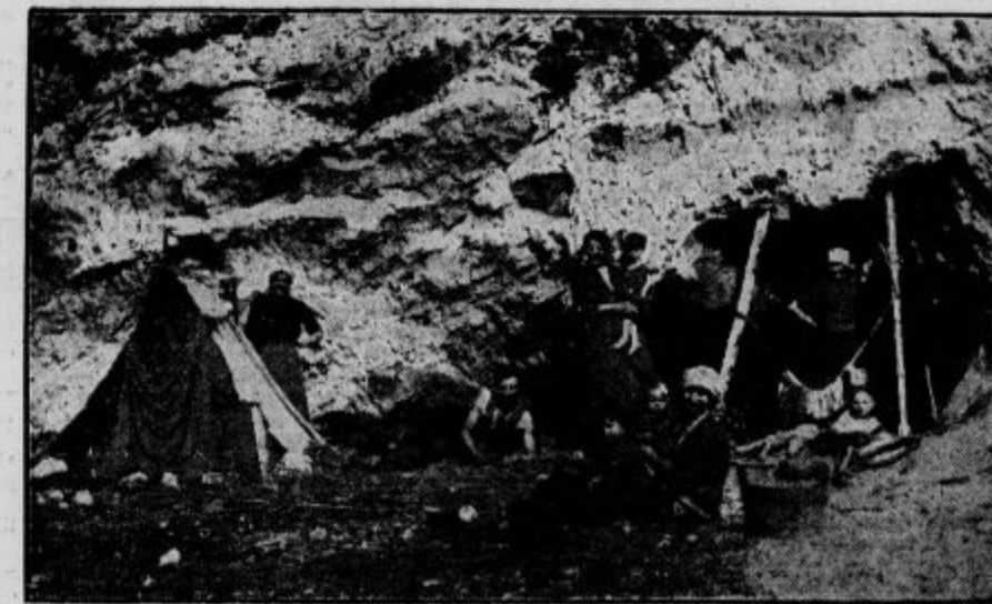
Tabor cigana Hodoroviča pred želujsko kraško jama pri Kočevju