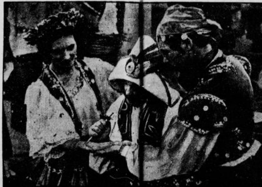
S krojo si potrđita ciganski ženina nevesta svestobo do groba