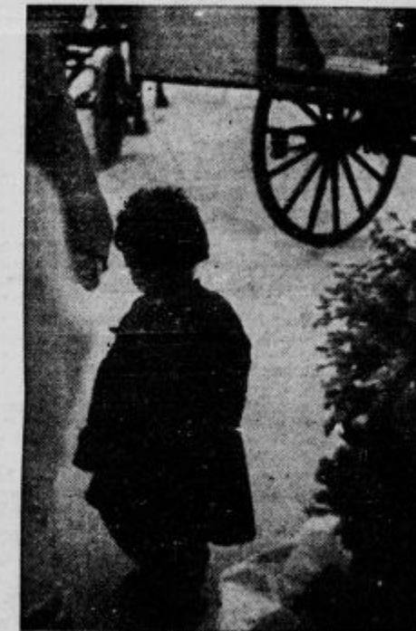
Ciganček gre za mrtvim očetom na zadnji poti