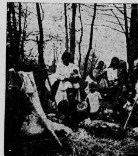
Ciganska karavana se je začasno naselila v gozdu