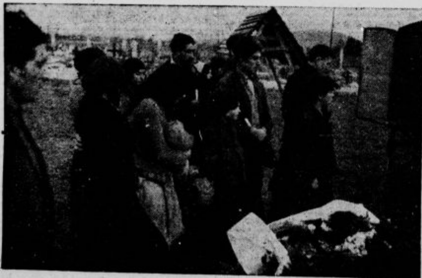
Ciganski pogreb v Ljubljani