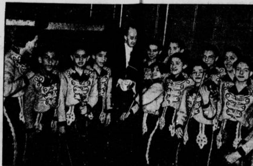
Orkester ciganskih otrok v madžarski Budimpešti