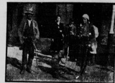
»Pleši, pleši, opica!«

Ko sem na vasi se igral, nihče ni maral me, nihče mi roke ni podal le vsak me karal je.