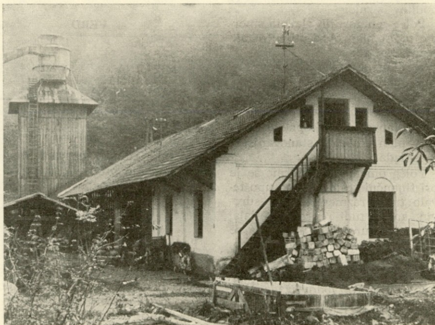
Stari objekti se umikajo novim

skladišče potrošnega materiala. Vsi navedeni prostori bodo v pritličju. V nadstropju pa bodo prostori za upravo naše PE. S tem ko bomo preselili upravo v nove prostore, bomo v sedanji upravni stavbi pridobili precej samskih stanovanj, katerih nam iz leta v leto več primanjkuje. Mislim, da bomo s pridobitvijo večjega števila samskih stanovanj lažje ublažili pomanjkanje delovne sile.