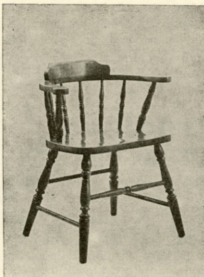
Stol — Tip »466«

kor nismo in tudi ne bomo v stanju, da bi se tej konkurenci zoperstavili z nižjo ceno, pač pa moramo skrbeti, da bo naša kvaliteta res prvovrstna in da osvojimo zahtevnejše izdelke, ker je to edini način, da se na tem zahtevnem trgu obdržimo. Kvaliteta naših stolov je v poprečju še kar zadovoljiva, ugotavljamo pa, da je število reklamacij zelo poraslo. Glavne napake so predvsem ohlapni čepi pri nogah in hrbtnih vezeh ter kvaliteta finiše. Pri tem mislimo na stole 347, 21/347, 22/347 in 2305. Večina teh napak je od proizvodnje polletje in jesen 1970. Dogaja se