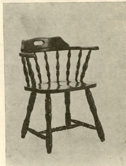
Stol — Tip »22«