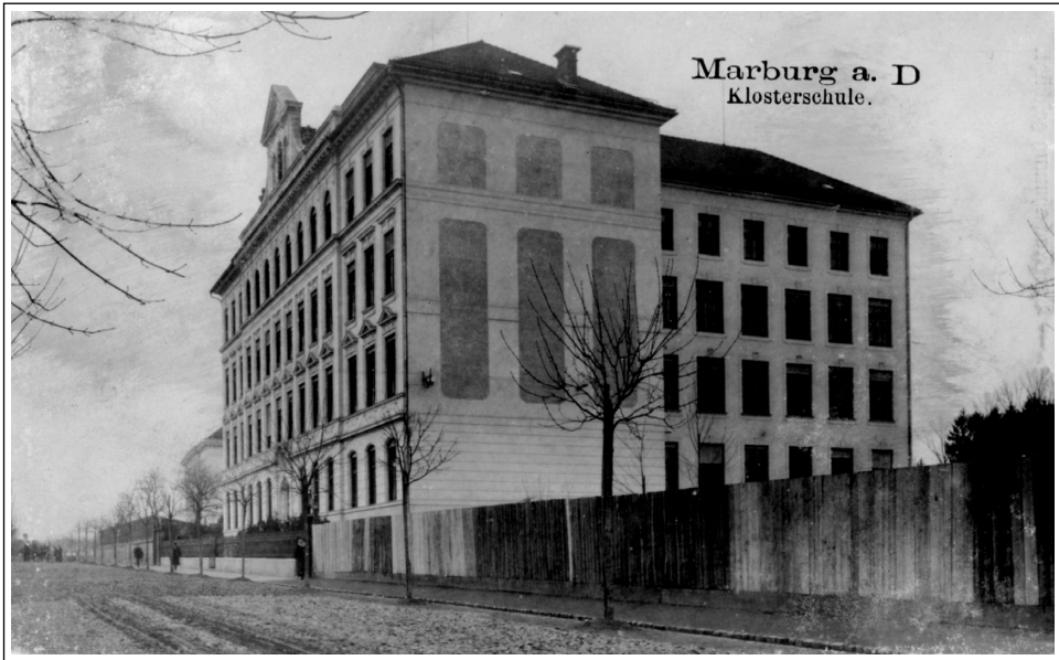
Slika 2: Učiteljišče šolskih sester v Mariboru

leta 1892 je v Mariboru delovalo tudi zasebno žensko učiteljišče, ki so ga odprle katoliške redovnice iz reda šolskih sester. Pravico javnosti je pridobilo leta 1896. 38 Poleg tega so v Mariboru leta 1902 ustanovili tudi državno žensko štiriletno učiteljišče. 39