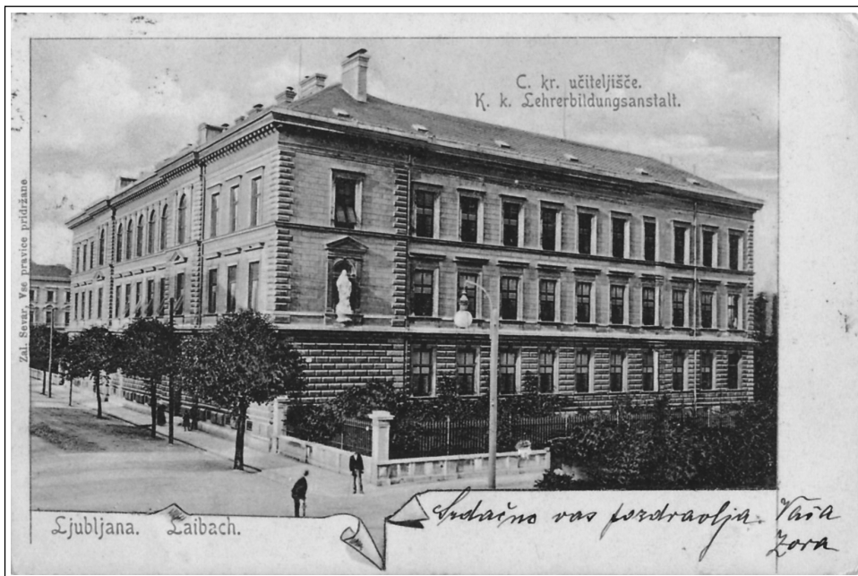
Slika 3: Učiteljišče v Ljubljani

zavlekla in so začeli izvajati štiriletni program šele v šolskem letu 1874/75. 43 Vzrok za daljše obdobje triletnega moškega učiteljišča v Ljubljani se je pripisovalo pomanjkanju učiteljstva in premajhnemu vpisu dijakov. 44 Z odlokom Ministrstva za bogočastje in uk z dne 25. avgusta 1871 so v Ljubljani v šolskem letu 1871/72 odprli štiriletno državno žensko učiteljišče. 45 Poleg državnega moškega in ženskega učiteljišča v Ljubljani sta bili na Kranjskem še dve zasebni ženski učiteljišči pri uršulinkah v Ljubljani (1869) s pravico javnosti leta 1902 in v Škofji Loki (1909) s pravico javnosti leta 1910. 46