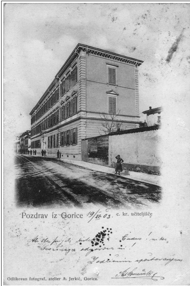
Slika 4: Učiteljišče v Gorici

na goriškem učiteljišču, so se morali za dokončanje šolanja preseliti na učiteljišče v Kopru. 48 Z odlokom z dne 10. julija 1875 sta se moški učiteljišči v Trstu in Gorici prenesli v Koper, kjer je bilo edino moško učiteljišče za celotno Avstrijsko primorje. 49