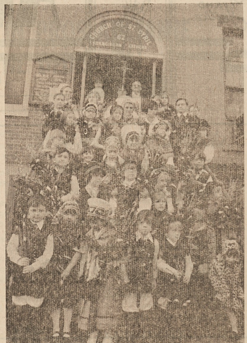
CVETNA NEDELJA PRI SV. CIRILU V NEW YORKU leta 1975. Otroci in odrasli v narodnih nošah s slovenskimi butaricami pred vhodom v cerkev.