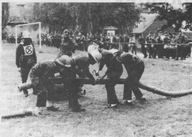
Sestavljanje sesalnega voda na tekmovanju

V nedeljo, 26. 5. 1991 je bilo na nogometnem igrišču v Trziču občinsko gasilsko tekmovanje, ki ga je organiziralo Gasilsko društvo Trzič.