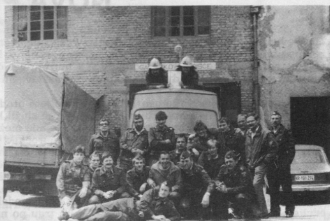
Desetini PEKO in PUR po tekmovanju