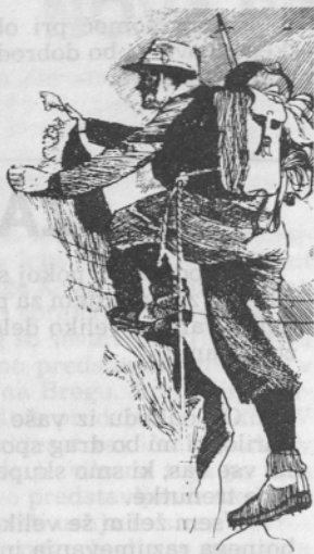
V hribe s pravo opremo.

Hitro se nam približujejo dnevi poletnih počitnic. Vsak od nas veliko pričakuje od težko zasluženih prostih dni, ko pa ti dnevi minejo, z grenkobo ugotovimo, da so minili brez pravega učinka, da so enostavno odtekli mimo nas. Še je čas, da se na te dneve pripravimo, čas, da se telesno in duševno okrepmo, da se poučimo in pustimo poučiti o različnih možnostih aktivnega življenja v prostem času.