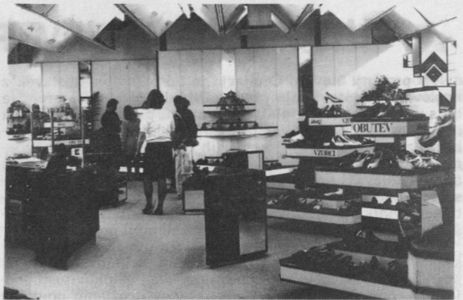
Prostorna modna prodajalna v Globusu

Tudi na področju furnitur (okrasni, etikete, vezalke itd.) in na področju podplatov skušam pomagati, da bi se nekurantni artikli vključili v proces. Dela je veliko, področje je široko, vendar delo opravljam z veseljem, zato ni težko.