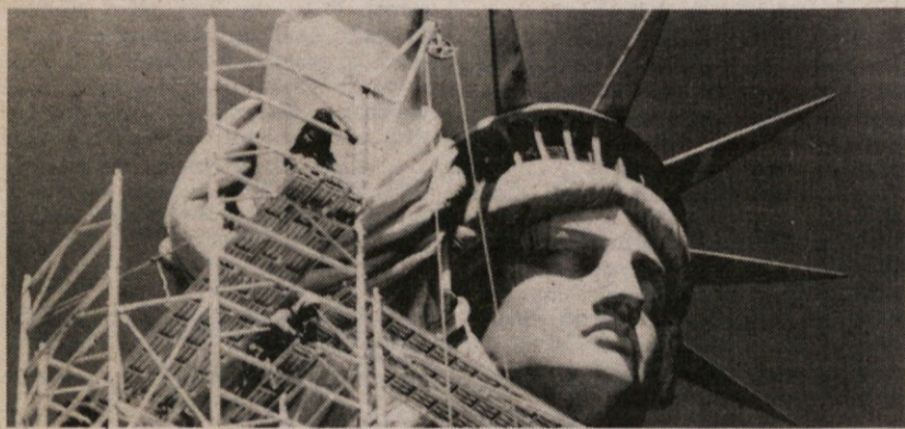
Tudi svoboda je treba kdaj pa kdaj restavrirati. Tokrat sicer samo kip svobode, za kar bodo odšteli nič manj kot 30 milijonov dolarjev