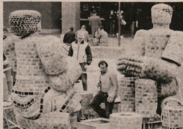
Zahodnoneški umetnik Klaus Schultze je v Münchnu končal svojo umetnino — prav posebne vrste vodomet oziroma fontano, ki naj bi razveseljevala mimoidoče