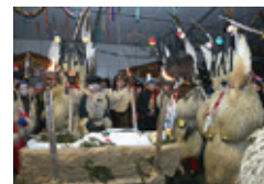
POKOP PUSTA IN PREDAJA OBLASTI 9. 2. ob 17. uri, Mestna tržnica