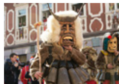
56. MEDNARODNA ETNO- KARNEVALSKA POVORKA 7. 2. ob 13. uri, Ulice in trgi