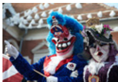
MESTNI PUSTNI KORZO 6. 2. od 10. do 13. ure, staro mestno jedro