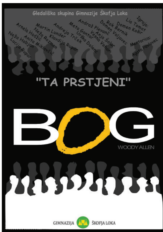
Plakat za gledališko predstavo Bog.