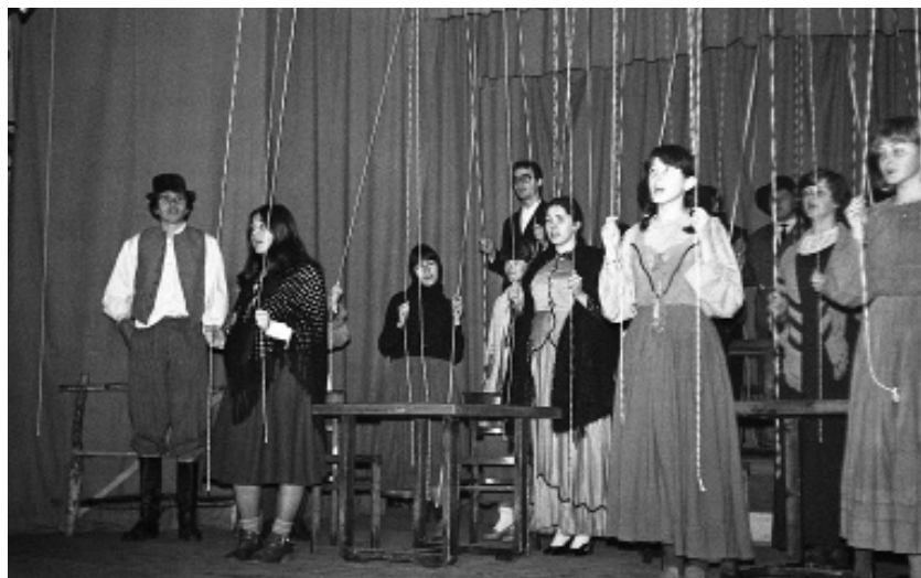
Prizor iz predstave Hlapci , zaključni song Ljudje na konopcih .

Moja ideja predstave se je vrtela okrog osnovnega konflikta: podložnosti in hlapčevstva proti svobodi misli, pokončnosti. Za podnaslov predstave smo uporabili besede iz drame: »Ljudje na konopcih«. Cankar piše, »naj ima učitelj glavo na voljnem konopcu, zato da se bo s pridom priklanjala na vse štiri strani«. Cankar in tudi mi smo mislili na vse ljudi in vse oblasti, ki med seboj bijejo boj za prevlado. Idejo smo krepili s sceno, ki so jo po celotnem odru predstavljale vrvice s stropa, ki so pomagale pričarati vzdušje lutk, ki jih vodijo oblastniki. Gledalce je ves čas spremljalo grozeče nihanje vrvic, ki so z nevidno roko vodile gibanje in gibe igralcev. Ustvarjen je bil občutek, da so ljudje vedno vodeni, le peščica jih je sposobna misliti po svoje, pa še ti na koncu v boju z oblastjo potegnejo krajši konec.