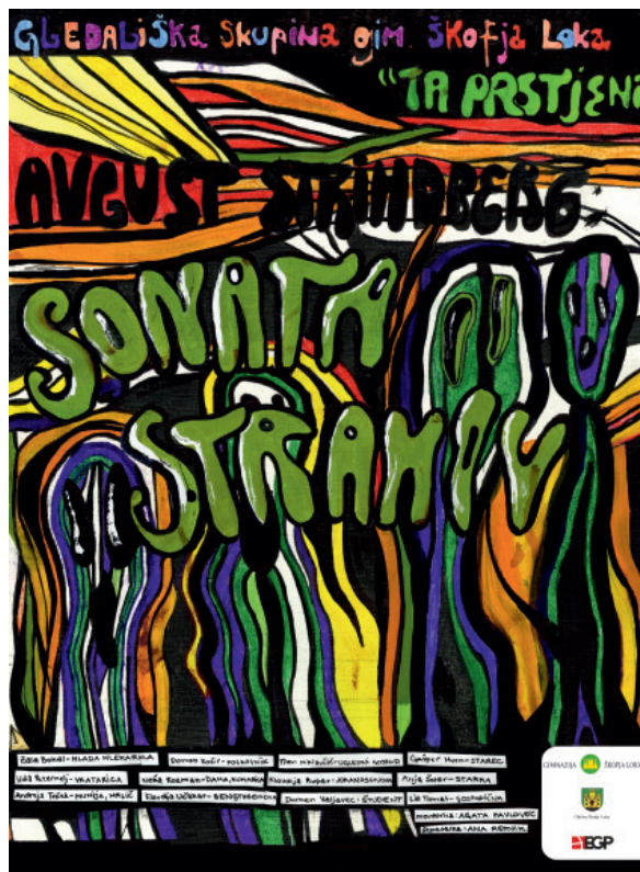
Plakat za gledališko predstavo Sonata strahov . (2012)