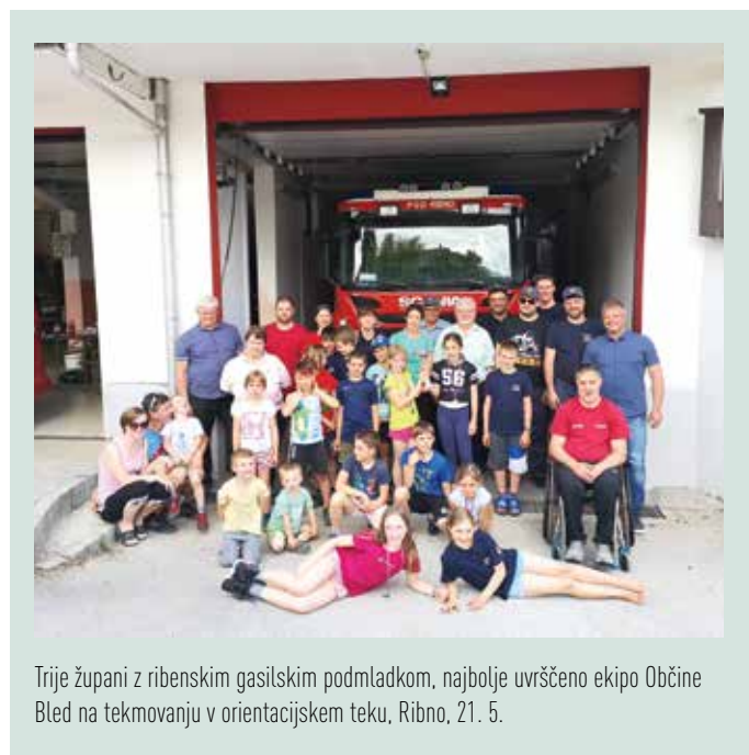
Trije župani z ribenskim gasilskim podmladkom, najbolje uvrščeno ekipo Občine Bled na tekmovanju v orientacijskem teku, Ribno, 21. 5.