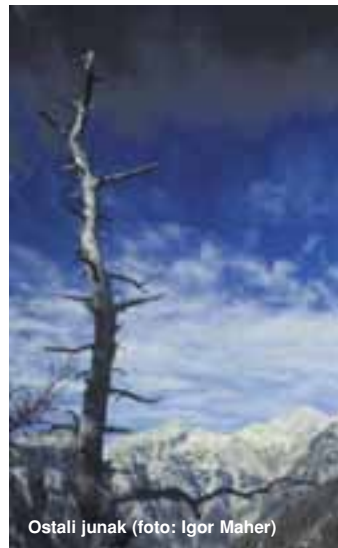
Ostali junak