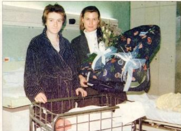
Darilo trgovine Pikapolonica za mlado mamico iz Ormoža

PRI IGNACU TOŠU IZ ZAGORCEV / Piše: Ivo Ciani - 4