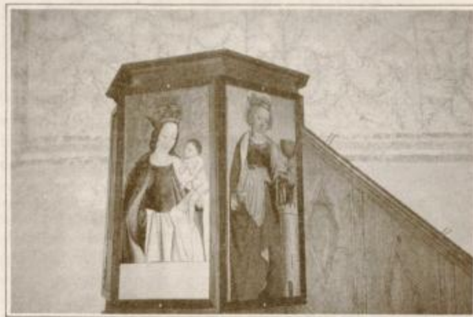
Del velike stenske slike in zanimiva prižnica v cerkvi sv. Miklavža na Koritnem

Po enournem odmoru v Oplotnici smo si ogledali zunanost tamkajšnje graščine ter se ponovno napatili v osrčje Pohorja, na Kebelj, ki leži na nadmorski višini 720 metrov. Če je na Šmartnem pihalo, da je neprijetno rezalo do kosti, je na tem delu Pohorja pričelo snežiti. Tako smo ob vsem doživeli še pravo zimsko pohorsko idilo. Kdo bi si mislil, da je imel ta tudi danes nekoliko odmaknjeni pohorski kraj v srednjem veku kar dva gradova. Zgornji je nastal na vzvišenem mestu nad vasjo, prvič se omenja konec 13. stoletja kot 'castrum Gybel', danes pa je v razvalinah, vendar