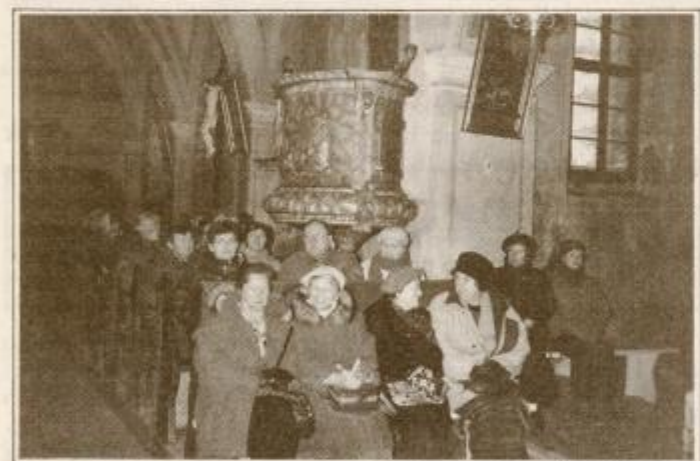
Nekoliko premrazeni udeleženci ekskurzije v cerkvi na Šmartnem

TEDNIKOVA KNJIGARNICA / TEDNIKOVA KNJIGARNICA / TEDNIKOVA KNJIGARNICA / TEDNIKOVA KNJIGARNICA