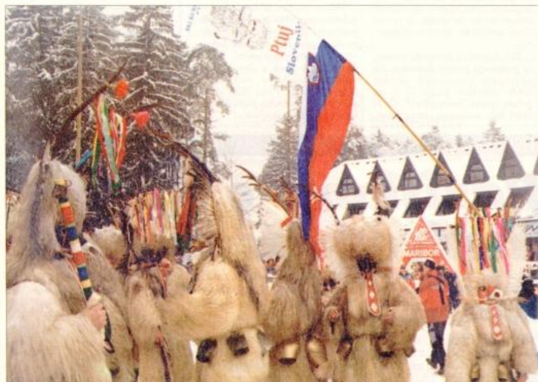
Na sobotni slalomski tekmi je pritegnilo pozornost tudi 18 kurentov iz Ptujja in Starše.

ja Pernilla Wiberg, 3. mesto in bronasto lisico pa Italijanka Deborah Compagnoni.