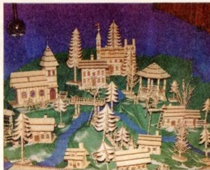
... in njeni izdelki iz vžigalic.