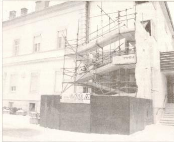
V tem mesecu bodo delavci Gradbenega podjetja Ptuj končali adaptacijo prostorov za aparat za računalniško tomografijo in zgradili vezni hodnik med kirurgijo in internim oddelkom.

Dr. Arko: "Glede na to, da naša bolnišnica v celoti pokriva ptujsko-ormoško območje, upravičeno pričakujemo njuno podporo, predvsem, kot sem že omenil, pri kategorizaciji bolnišnic in pa seveda tudi v strategiji razvoja. Strategija razvoja