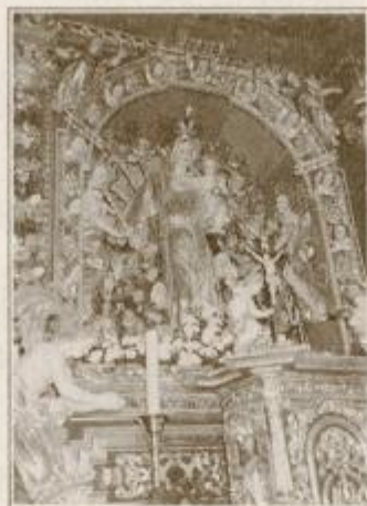
Zanimiv oltar v župni cerkvi na Prihovi. Svoj čas je bila cerkev Marijinega varstva znana romarska pot.

Zaradi mraza, ki je prodiral iz vseh zidov, smo se kljub nadvse zanimivi razlagi radi vrnili v topel avtobus, ki nas je peljal v dolino. Kljub meglenemu dnevu, ki je napovedoval sneg, smo svet pod sabo videli kot na dlani. Na robu obzorja sta izstopala mižasta Donačka gora in Boč.