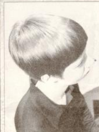
Frizura z modnim pramenom

Na straneh Tednika smo v zadnjem času nekajkrat pisali o modnih zapovedih v pričeskah v novi sezoni. Naj jih na kratko obnovimo: raznobarni prameni, spredaj daljši, zadaj krajši lasje, okrogle linije, kratki frufriji pod daljšimi lasmi, ravni lasje, razkuštrani lasje, nore intenzivne barve, pri dolgih laseh pa, če želimo biti "in", jih je treba s posebnimi škarjami skrepati. Nekaj novih modnih trendov v frizerstvu si lahko ogledamo