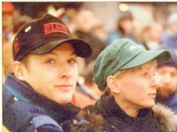
Na 34. zlati lisici sta bila v središču pozornosti tudi najboljša slovenska športnika leta 1996 Andraž Vehovar in Brigita Bukovec.