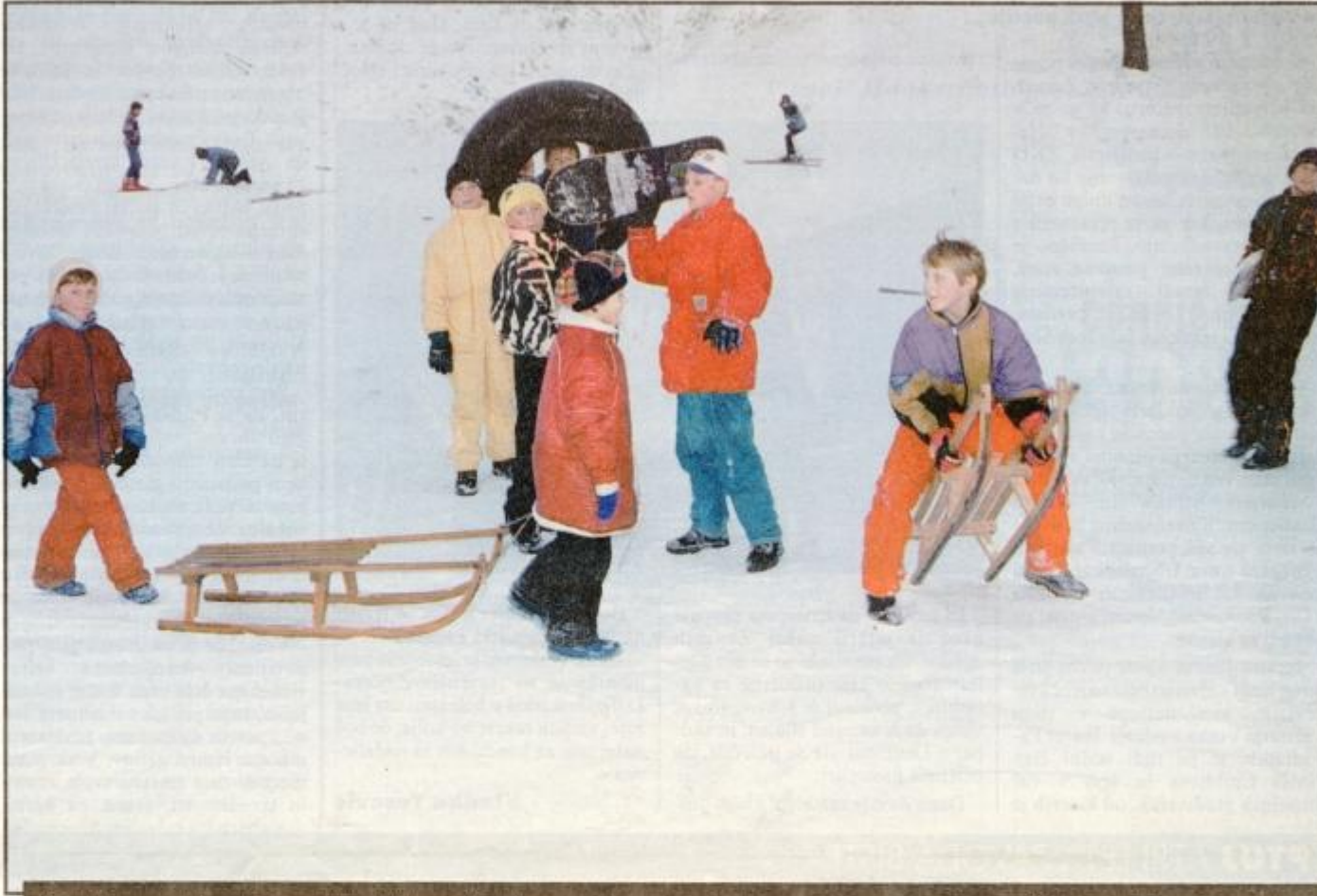
Snežne radosti na grajskem hribu

Po starih izkušnjah pripravil Marjan Koko!