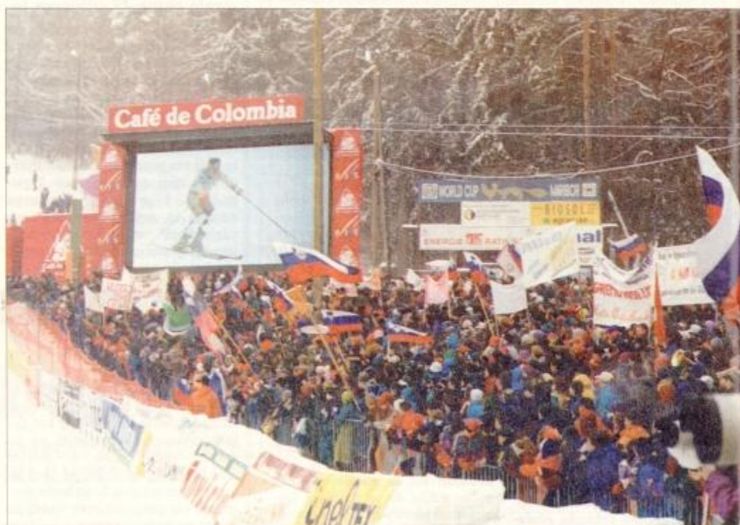
Kljub slabemu vremenu je bilo v soboto pod mariborskim pohorjem okoli 15.000 obiskovalcev.