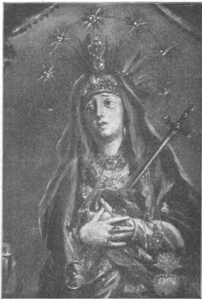
Zalostna Mati božja na Kalvariji v Jeruzalemu.

točka za premalenkostno!) pridobiva družba na ugledu, s časom pa tudi na prijateljih in udih. — Letošnjo zimo so se družabniki s svojimi družinami vred sešli enkrat k zabavnemu večeru. Ni bilo bogve kakega sijaja, pač pa dokaj pristrčne prijaznosti, ki bo tudi njih posamezne družine malo bolj spojila. Pripravljamo za letos že tudi svojo božjo pot, da vam kar naprej povem, k žalostni Materi božji v opatijski cerkvi v Zatičini.