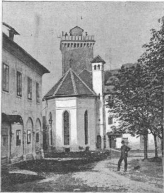
Kapelica sv. Jurija na ljubljanskem gradu.

Ali vrata se še bolj odpro in v sobo vstopi umirajoči dušni pastir, opiraje se ob dva moža.