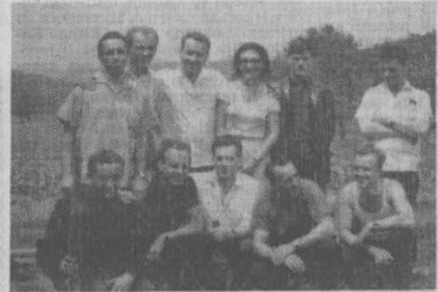
Najboljši velenjski strelci v družbi z državnimi reprezentanti iz Celja na strelišču v Lajšah.

Da bi se prizadevanja uresničila, je upravni odbor kluba po organizacijski strani pripravil plan in obseg dela ter uvedel delitev nalog, tako da bo vsak član odbora vedel kaj je njegova naloga. Po tehnični strani pa bo storjeno vse, da bi se končno utrdila ekipa s solidnimi igralci, ki so pripravljeni z dobro organiziranimi treningi v spomladanskem delu nadoknaditi zamujeno.