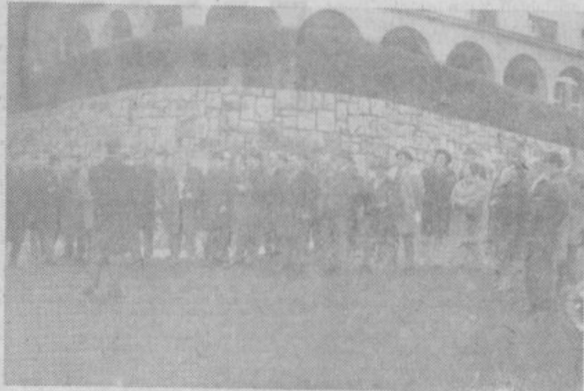
Udeleženci na otvoritvi nove ceste v Topolšici.

Prispevki podjetij in ostalih so znašali skupaj 13 milijonov starih dinarjev. Ostale stroške pa nosita cestni sklad občinske skupščine Velenje in bolnišnica Topolšica.