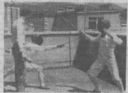
Sabljači so se poleti pridno pripravljali kar na vrhu stanovanjskega bloka.

organizacijo tekmovanj. Zaradi pomanjkanja teh rekvizitov se niso mogli udeležiti več tekmovanj.