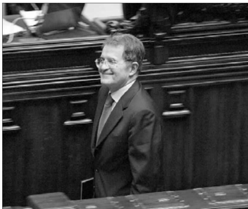
Romano Prodi med včerajšnjim poimenskim glasovanjem v poslanski zbornici

Sicer pa niti v desni sredini ni popolnega soglasja. Če sta voditelja FI Silvio Berlusconi in NZ Gianfranco Fini zahtevala takojšen odstop vlade in predčasne volitve, je prvi mož UDC dopustil možnost oblikovanja začasne tehnične vlade. Vodja SL Umberto Bossi pa je zagrozil, da če ne bo predčasnih volitev, bo v Padaniji »oborožena vstaja«.