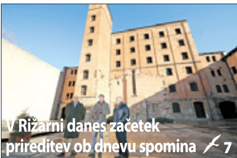
V Rižarni danes začetek prireditve ob dnevu spomina 7

Enotna fronta goriških upraviteljev zahteva soočanje o zdravstvu