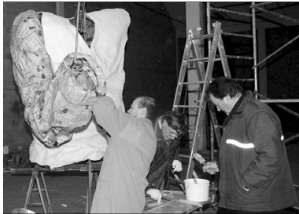
Štmavci med gradnjo pustnega voza

Ob velikem vozu bo korakalo rekordnih stotrideset pustnih navdušencev