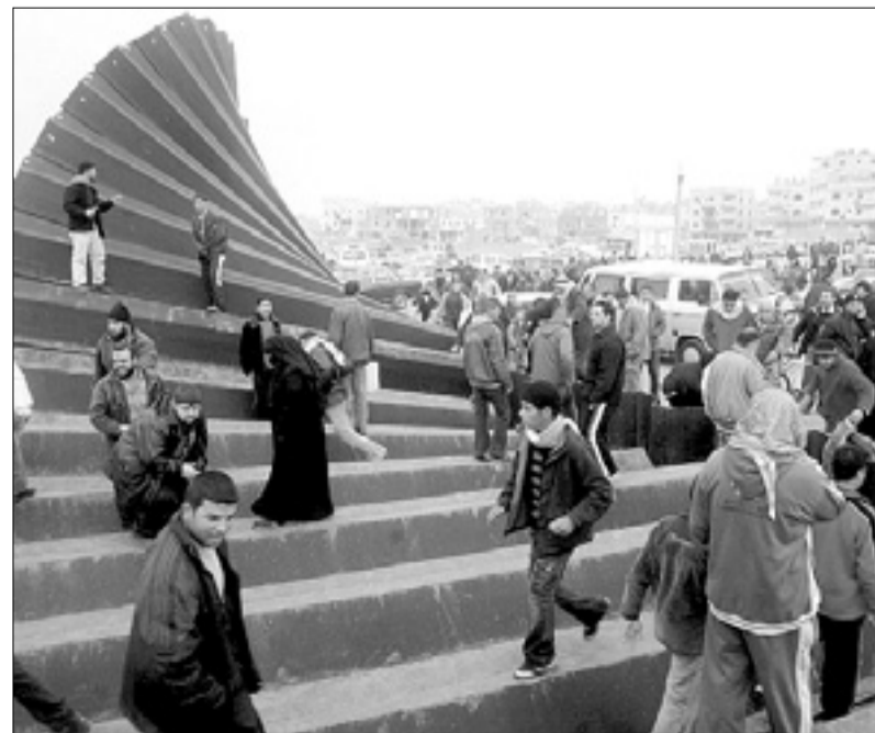
Prebivalci Gaze na podrtem mejnem zidu