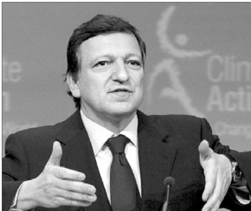
Predsednik Evropske komisije Jose Manuel Barroso

Predsedstvo računa na "konstruktiven pristop in podporo s strani držav članic in Evropskega parlamenta", kar naj bi vodilo do končnega sprejema paketa najkasneje do pomladi 2009. Hkrati pa predsedstvo poudarja, da je treba od držav in industrije zahtevati uravnotežene in sorazmerne napore, ki upoštevajo njihove okoliščine. (STA)