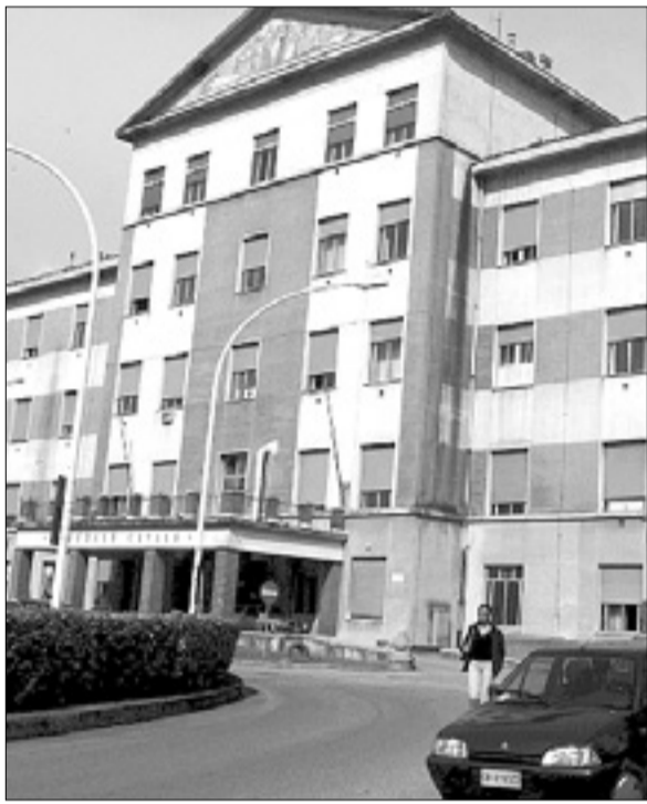
Goriška splošna bolnišnica