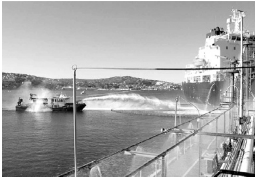
Vajo so izpeljali med tržaškim pristaniščem in Miljami

Skupna vadba, ki je vsebovala tudi poseg proti onesnaženju morja, je potekala med 11. uro in 12.30 na območju terminala ogljikovodikov SI.LO.NE. (Sistemi Logistici Nordest), kjer je bil zasidran italijanski tanker »Azahar«, ki prevažata bencin. Med vajo so vključili protipožarne naprave tako v terminalu kot na krovu tankerja, medtem pa so simulirali izliv goriva v morje: lažni madež so izolirali s pomočjo ladje podjetja Crismani in drugih sredstev. Ob koncu so še uprizorili reševalno akcijo za ranjence na ladji. Skupne vaje se udeležujejo vse ustanove, zadolžene za posege v nujnih primerih. Po navodilih ministrstva za prevoze se morajo podobne vaje ponoviti vsakih šest mesecev.