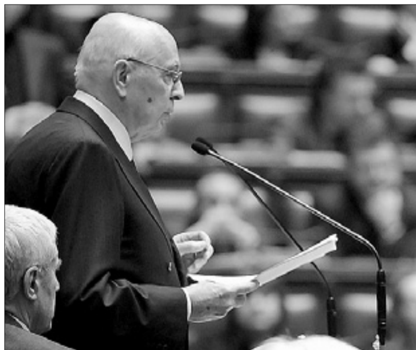
Predsednik republike Giorgio Napolitano med govorom v poslanski zbornici

Predsednik senata Franco Marini je spomnil, da predstavlja svečanost »eno od najvišjih točk našega institucionalnega življenja.« Tudi on je iznesel potrebo po »institucionalnih prilagoditvah, da bi bila naša demokracija še bolj učinkovita pred tolikimi problemi, ki trkajo na vrata.« Te spremembe so nujno potrebne, kajti demokratični princip je temelj našega ustavnega ustroja, je še dodal.