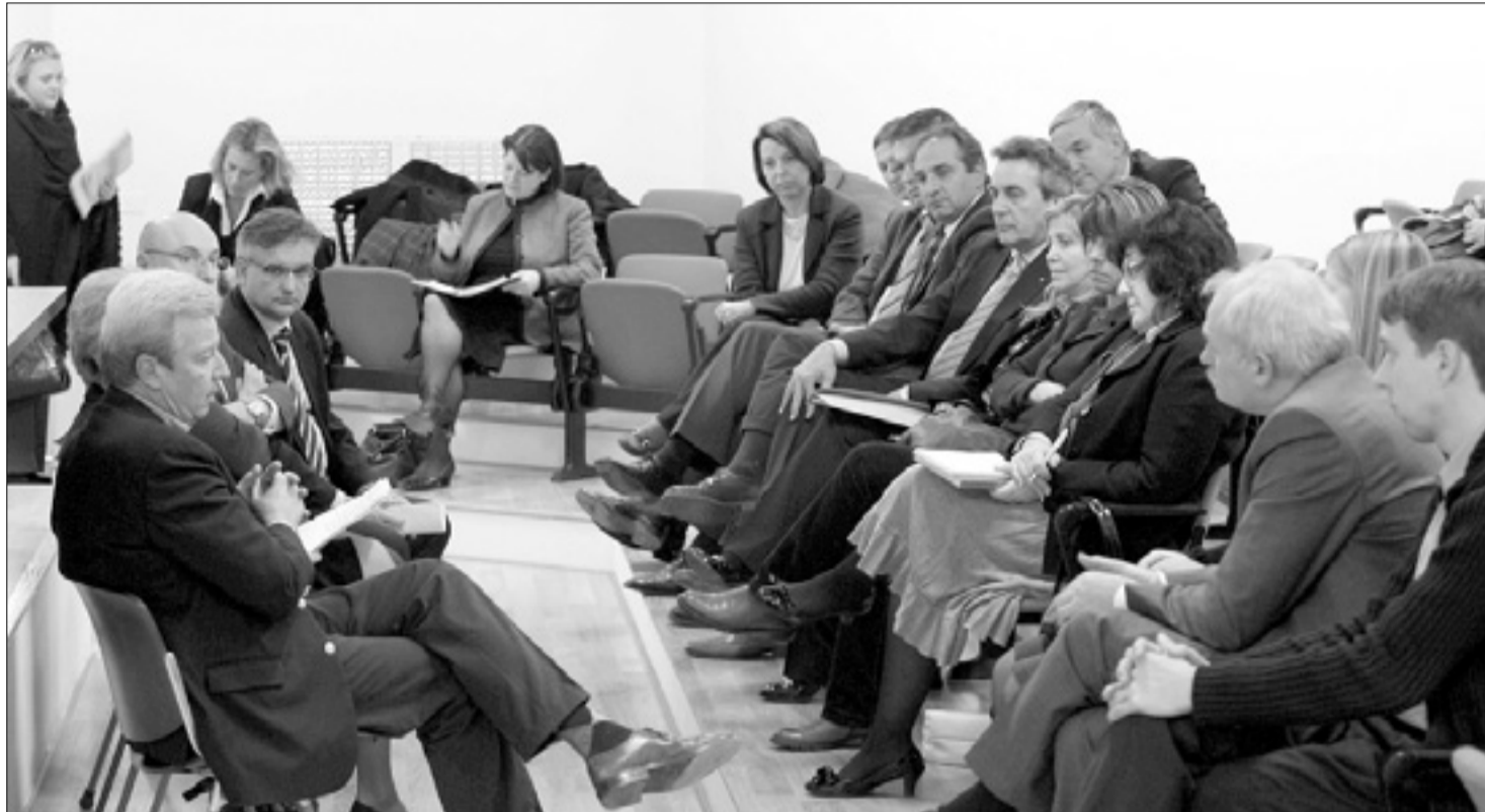
Upravitelji so se srečali v avditoriju razstavnega prostora na četrtem pomolu starega pristanišča

O njih se bo razpravljalo na tehničnih omizjih - Prvo omizje bo v torek v Komnu