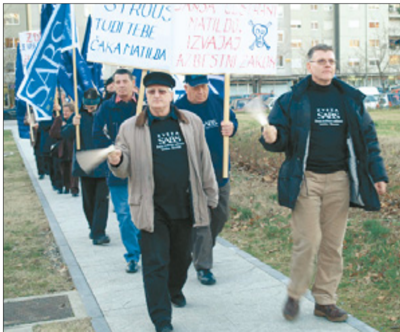
Protestni shod zveze SABS

Kot so zapisali v obrazložitvi peticije, si v zvezi SABS že od leta 2000 prizadevajo za ustrezno ureditev zdravstvenega in socialnega statusa državljanov, izpostavljenih negativnim vplivom azbestnih vlaken. Izrazili so tudi prepričanje, da so s prejšnjo oblastjo dobro sodelovali, saj je upoštevala mnoge njihove predloge, in da po volitvah leta 2004 ni več tako. Po-