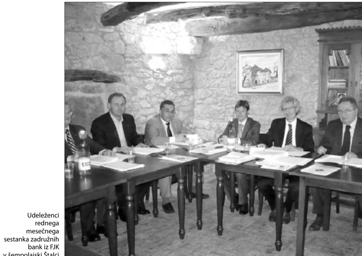
Udeleženci rednega mesečnega sestanka zadružnih bank iz FJK v šempoljski Štalci

Gostje so poleg kulinarčnih posebnosti spoznali še eno pomemb-