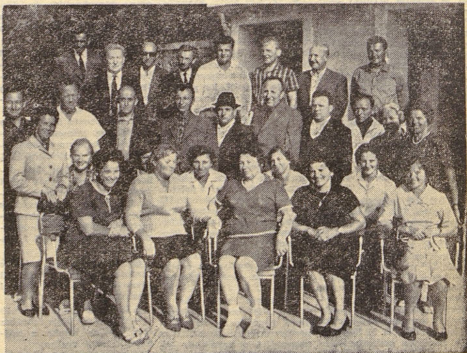
Člani ZB iz »Elektromehanike«, ki so v septembru deset dni letovali v našem počitniškem domu v Poreču

ISKRA — glasilo delovnega kolektiva Iskra industrije za elektromehaniko telekomunikacije elektroniko in avtomatiko — Urejuje uredniški odbor — Glavni urednik: Pavel Gantar — odgovorni urednik: Igor Slavec — izhaja tedensko — Tisk in klišej: »CP Gorenjski tisk« Kranj