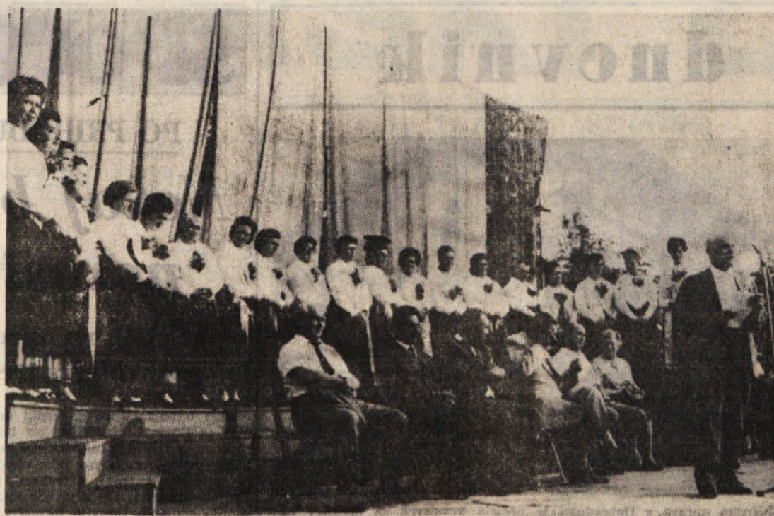
Na sliki skupina domačin iz Bazovice, ki so se velikega mednarodnega partizanskega slavlja v Bazovici udeležile oblačene v prelepe narodne noše. To je veličastnemu zborovanju dalo še prav poseben poudarek

Kako naj bi se dosegel mir - Spopad med različnimi interesi - Od nekaj tisoč ameriških svetovalcev leta 1954, se je vojaški kontingent ZDA v Vietnamu danes dvignil na pol milijona vojakov - Najnost odločilnega koraka