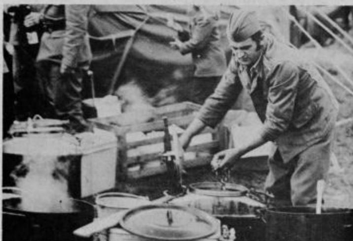
Tu se je pripravljaj pasulj za teritorialce.