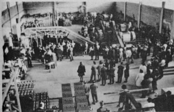
Ormoški samoupravljalci na zboru v novi opekarniški proizvodni dvorani.