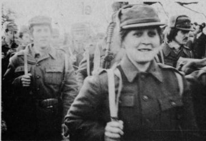
Dekleta so stopala skupaj z moškimi tovariši.