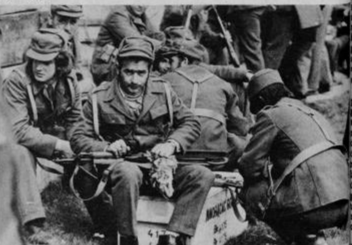
Po uspeli vaji so sicer utrujeni udeleženci pohoda očistili orožje.