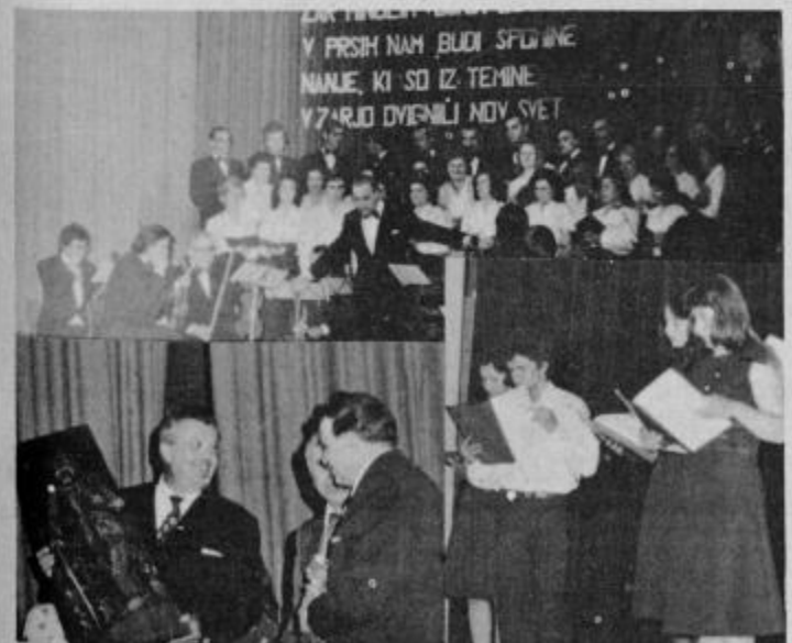
Člani KUD Abrašević iz Vrnjačke Banje, zgoraj zbor in orkester, spodaj desno recitatorji, levo pa predsednik društva sprejema spominsko darilo.