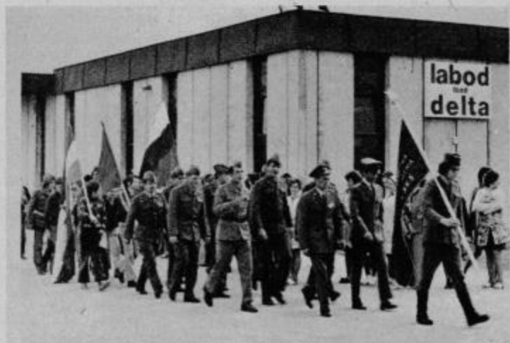
Del „Krambergerjevcev“ pred Labodom: „Naša četica koraka...“