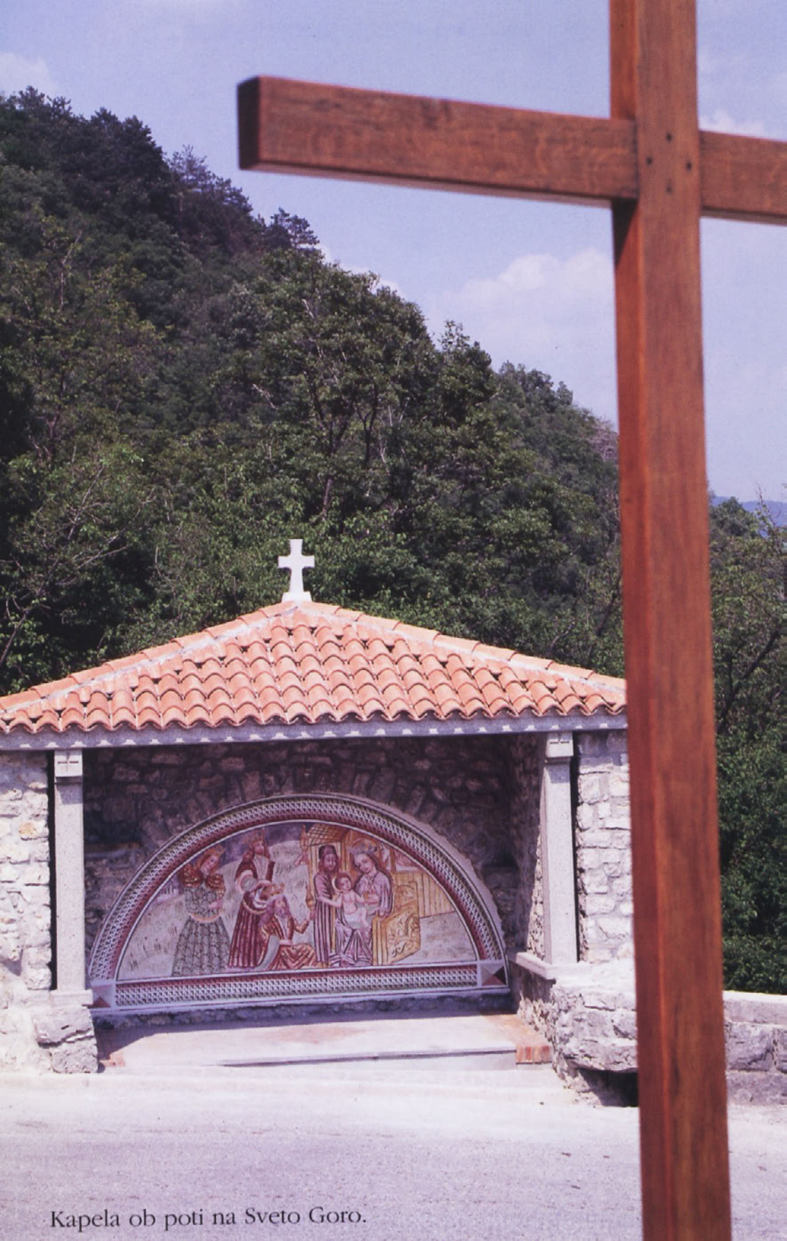
Kapela ob poti na Sveto Goro.