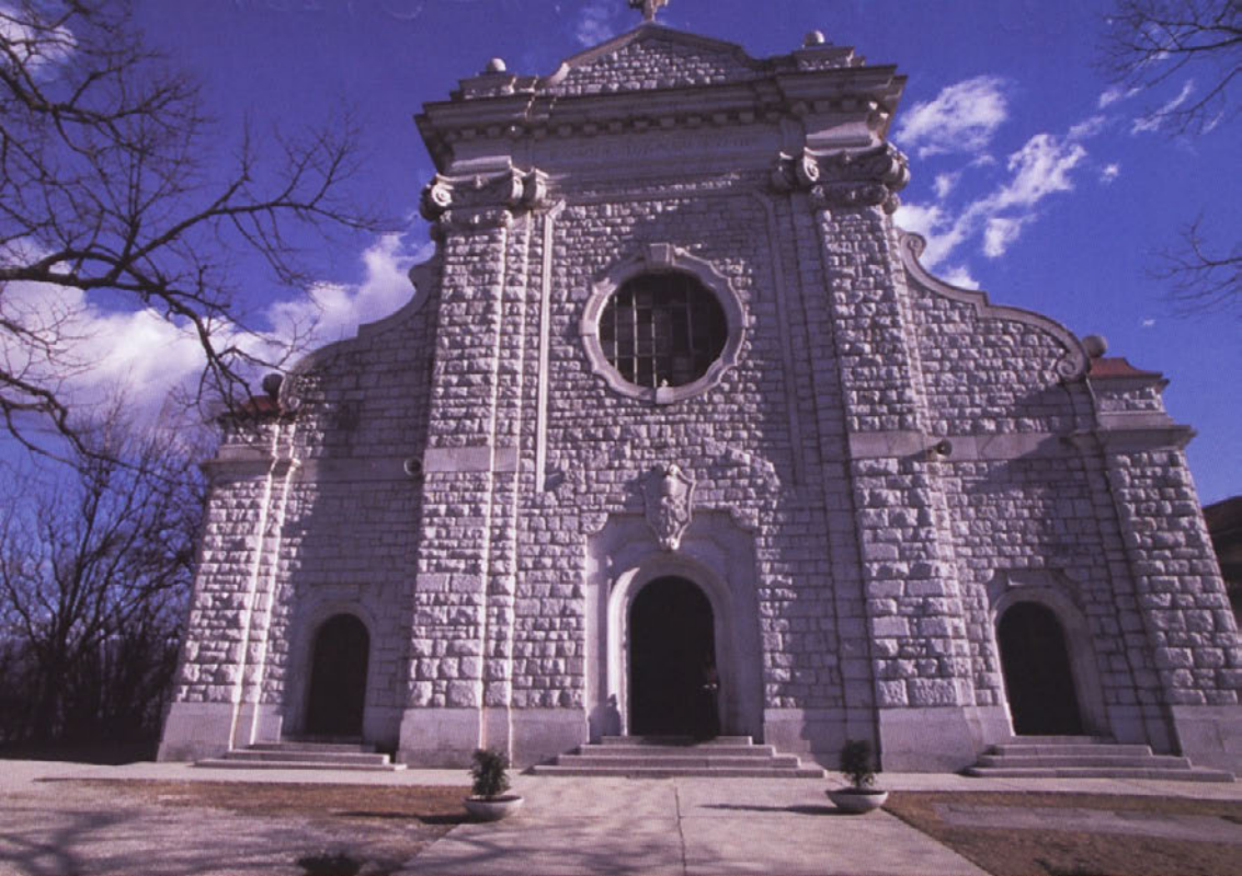
Sveta Gora, zahodna fasada.