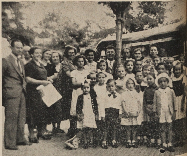
Paternalna šola odhaja na letovišče v S. Antonio de Padua FCÖ