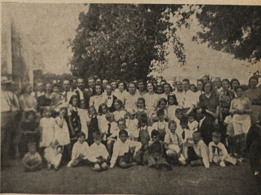
Paternalna šola je pohitela na letovišče v S. Antonio de Padua. Prav dobre volje so tamkaj v senčnem vrtu in na čistem zraku, posebno v nedeljo, kadar jih obiščejo starši.