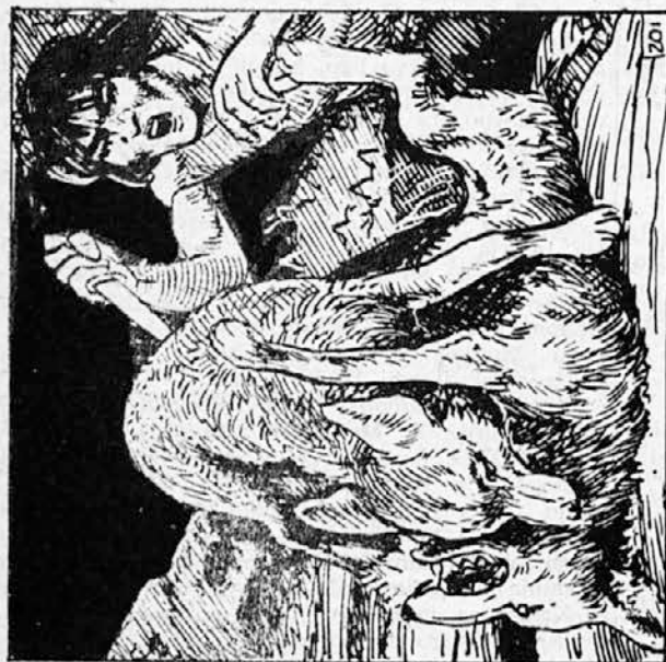
201. Stari Akela se je z brezobnimi čeljustmi divje zagrizel v bedro rdečega psa in že sta ga z obeh strani za boke popadla dva nova. Vodnik Fao je popadal daleč za vratove in jih vlekel v stran, kjer so z njimi dokončali enoletniki. Mavgli je z bliskovitimi in nezgrešljivimi sunki rešil življenje marsikateremu volku, ki ga je že dušil dolov stisk.