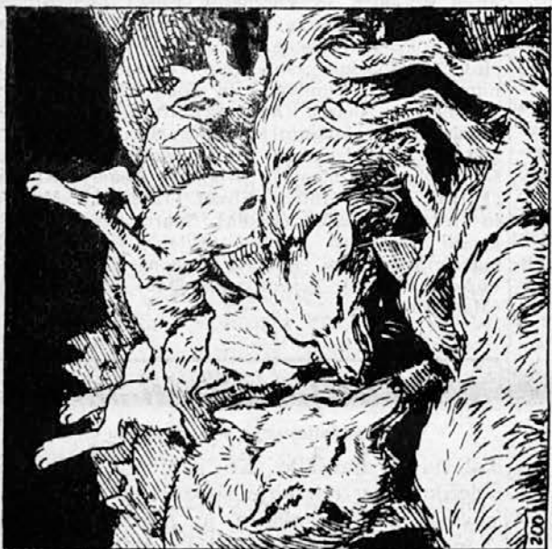
200. Volk enoletnik, neizkušen borec, je bil ubit že v prvem spopadu. Gneča borečih se teles ga je dvignila na vrh žive kopicice, njegova mati pa se je vsa poblaznela od žalosti in jeze vrgla čez njegovo truplo, grizla in popadala okoli sebe in se zaganjala naprej. Včasih se je iz kopicice odvlekel ranjen volk in odvlekel tri, štiri napadavce s seboj.