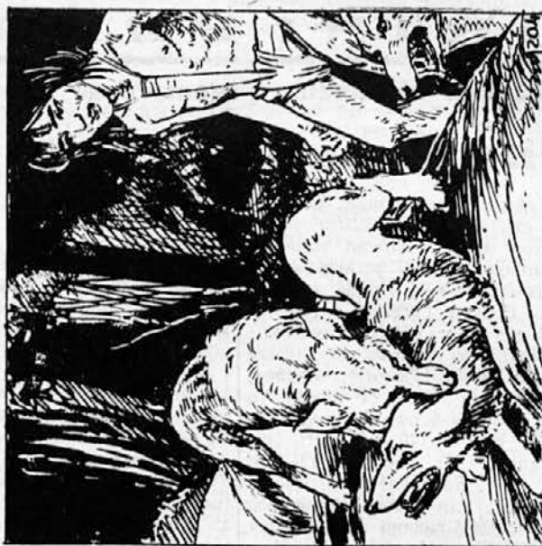
204. Razmesarjeni samotnik je s strašnim stiskom čeljusti ohromil nasprotnika, da ga ni mogel napasti. Mavgli ga je pogledal: »Pri biku, ki me je odkupil, to je vendar brezrepec!« Bil je res veliki rdečkasti vodnik. »Hej, brezrepec, mislim, da te bo tale volk, ki mu je ime Von — tola, ubil!« In že je z nožem odgnal dola, ki je priskočil vodniku na pomoč.