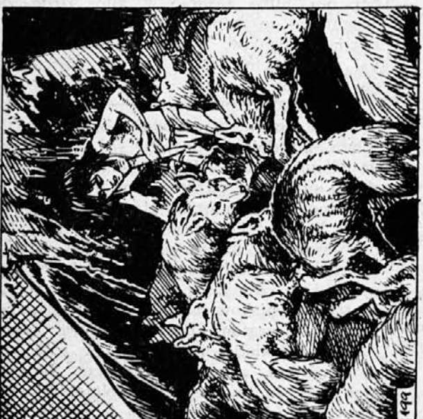
199. Ves boj se je zgostil v grozljiv vrtinec, v en sam zapleten velikanski voz. Sklenjena gmota se je pomikala po bregu zdaj na levo, zdaj na desno. Iz nje se je kdaj pa kdaj dvignila gomila teles, iz katere je odletelo pet ali šest ranjenih psov. Takoj nato pa so se splazili nazaj in se kljub ranam poskušali preriniti v sredino boja.