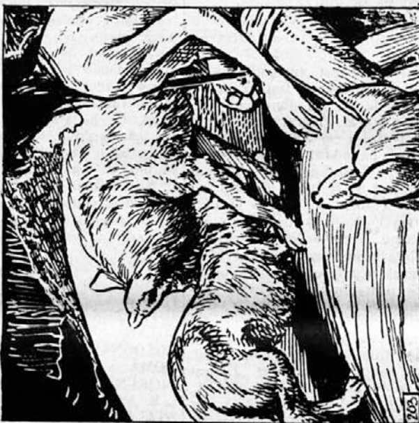
203. Enoletniki so postajali pogumnejši in Mavgli se je lahko od časa do časa malce oddahnil in se ozrl za prijatelji. Bojeviti Sivi brat je krvavel namaj iz dvajsetih ran, a se je še vedno boril. Deček je poiskal samotnega volka. Zagrizel se je v bok krenkega dola in Mavgli mu je z nožem priskočil na pomoč. »Pusti ga!« je zahropel Van — tola.