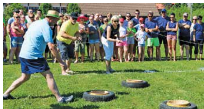
Metanje podkev v slamnice se je odvijalo pod budnim očesom sodnikov.

vlje-Šentjanž in Pobrežje so se pomerile v vožnji samokolnice, teku okoli količkov, metanju podkev, štafeti z vodo, sestavljanju grba in vlečenju vrvi. Manjkala je edino ekipa Varpolj.