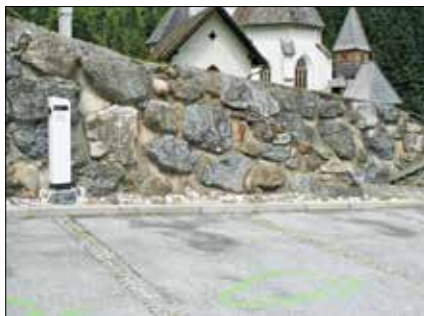
Ena od polnilnic za električne avtomobile stoji na parkirišču ob cerkvi v Solčavi.