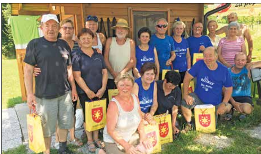
Prijateljski tekmi v Gornjem Gradu je sledilo druženje balinarjev treh društev.