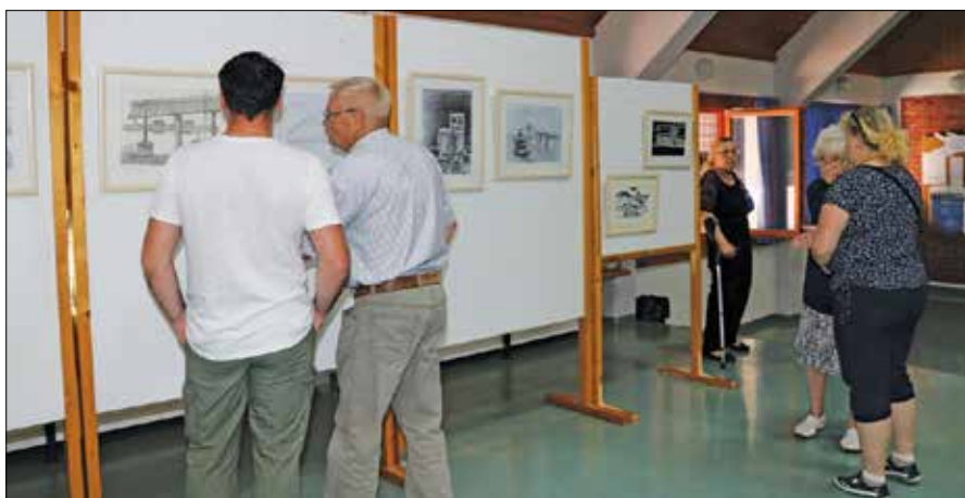
Obiskovalci so se lahko prepričali, da umetniška risba nosi neko enkratnost in je na papirju na enak način ne moremo ponoviti.