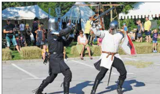
Obiskovalci so bili priča tudi srednjeveškim bojem.