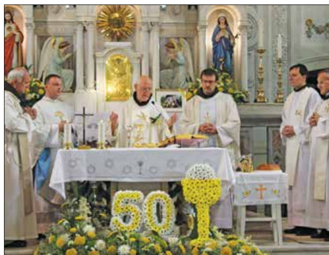
Svečan dogodek je obeležil z zlato mašo v nazarski farni cerkvi minulo nedeljo.