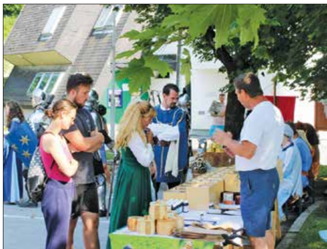
Obiskovalci so se lahko ustavili tudi v srednjeveški lekarni.

so člani Društva Srednjeveški najemniki predstavili življenje najemnikov, vitezi Reda kraljevega orla pa so se pomerili na viteškem turnirju. Zavod Enostavno prijate-