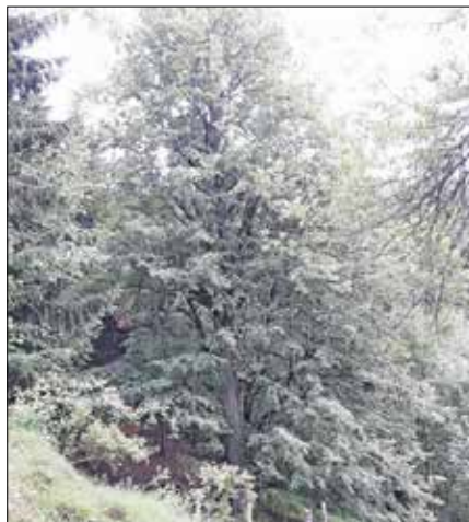
Kladnska lipo na kmetiji Kladje v Teru pri Ljubnem ob Savinji

Lipo dočaka zelo visoko starost, do 1.200 let, lipovec okrog 800 let. Ugotavljanje starosti lip na osnovi premera je oteženo, saj je pogosto