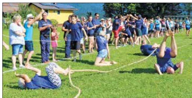
Rečička ekipa je ob zmagi v vlečenju vrvi le-to potegnila tako močno, da so popadali po tleh.