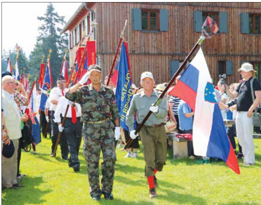
Slovesnosti na Menini so se udeležili številni praporščaki.