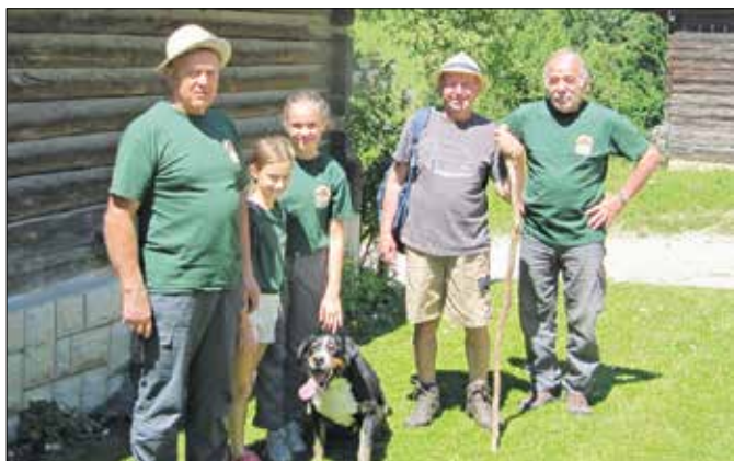
Skromna udeležba na pohodu po Jurčkovi poti je bila posledica najbolj vročih dni v tem poletju.

Naročniki Savinjskih novic imajo 15% POPUST pri objavah zahval.