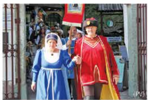
Dvorišče grada Vrbovec v Nazarjah ponovno srednjeveško obarvano

- Velik nabor paketov po mega akcijski ceni od 1.49 do 12.49 EUR na mesec - Več prenosa podatkov - Zadnji modeli telefonov po znižanih cenah Več informacij na www.megatel.si