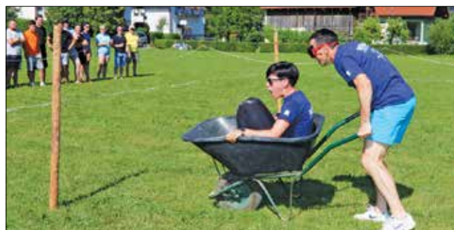
Da je moški s prevezanimi očmi lahko vozil žensko, je ta morala dati natančna, jasna in glasna navodila.

merili ekipi Poljane-Dol-Suha in Rečica. V izenačeni borbi so z zadnjimi močmi vrv na svojo stran potegnili Rečičani. To jim je prineslo naziv najboljšega, pokal in prehodni pokal, ki je ostal v njihovi lasti od preteklega leta. Za ovrtnik so jim skozi vse igre dihali Spodnjerečičani, a so se morali zadovoljiti z drugim mestom. Tretji so bili Pobrežani.