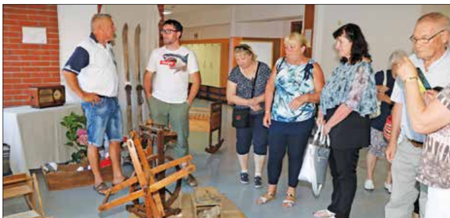
Veliko zanimanje je na razstavi Živeti z lesom požela krtača za volno, motovilo in kolovrat, ki so jih žene uporabljale za krtačenje, navijanje ter predenje volne in lanu.