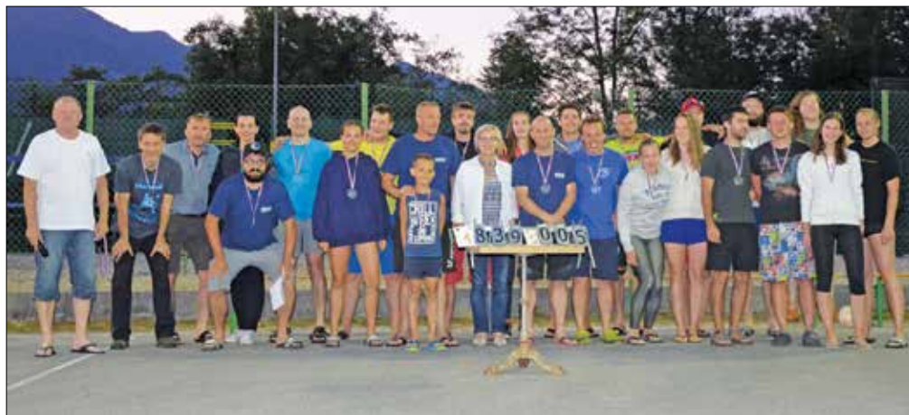
Na maratonu ni manjkalo znanja, vrhunskih potez in vzdržljivosti, kar je pripeljalo do visokega točkovnega izkupička.

ŠALJIVE IGRE MED NASELJI NA REČICI OB SAVINJI