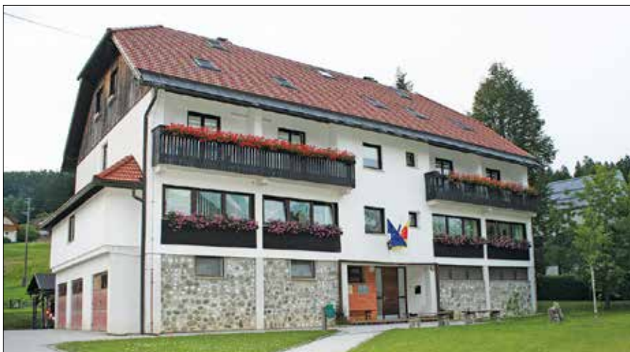
Zgradba na Kocbekovi cesti, kjer domuje Komunala in kamor se bo selila gornjegrajska občina.