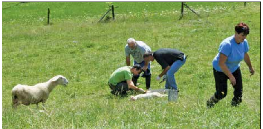
Ovca mati je s presunljivim blejanjem klicala svoje mrtvo jagnje, ki sta ga pregledovala ocenjevalca škode.

Ljubno ob Savinji: Mozirski policisti so 11. julija opravili ogled vloma v stanovanjsko hišo na Ljubnem ob Savinji. Neznani storilci so pregledali prostore in odnesli več kosov električnega orodja.