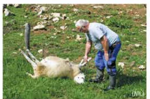
V Podvolovljeku pomor šestih jagnjet, poginila tudi visoko breja ovca