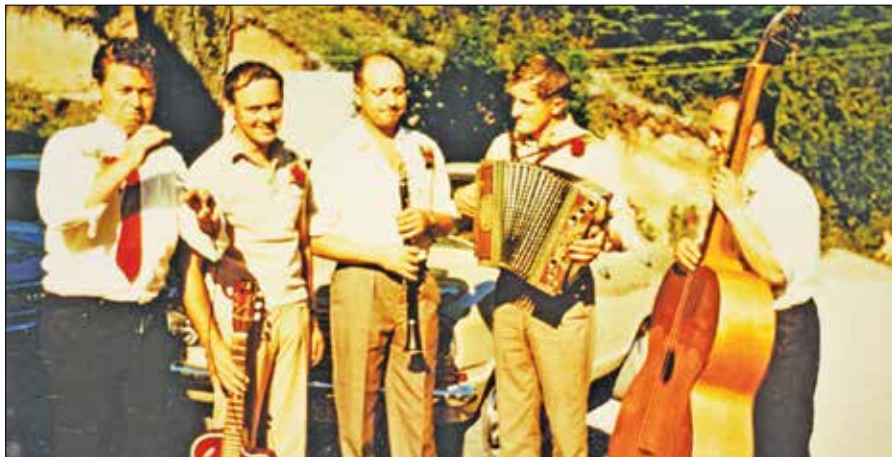
Eden od sestavov Solčavskih fantov

Kot ljudski godci so sodelovali na številnih kulturnih prireditvah, državnih in lokalnih slovesnostih, za kar so med drugim prejeli zlato priznanje za doseganje kakovosti na srečanju ljudskih godcev pri izvajanju ljud-