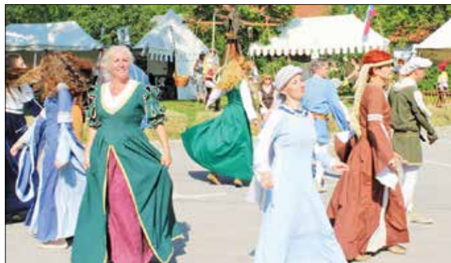
Člani KUD Galiarda so prikazali, kako so plesali na srednjeveški dvorih.

lji je za najmlajše pripravil srednjeveško gledališko predstavo Dvorni norček Beni, zaplesale so trebušne