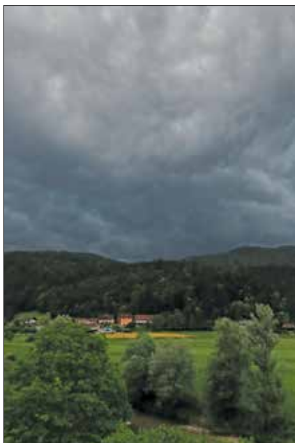
Majsko in junijsko vreme je bilo nenavadno hladno in deževno.

Ekonomisti menijo, da bo verjetna posledica uničenih pridelkov in posledično zmanjšane količine ponudbe le-teh rast cen nekaterih osnovnih živilskih proizvodov.