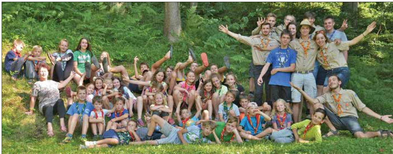
Teden dni se je družilo skoraj štirideset otrok.