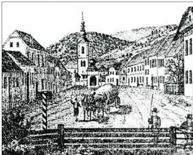
Upodobitev Mozirja iz začetka 19. stoletja

leta 1146, in sicer v darilnem pismu oglejskega patriarha Pelegrina, izdanega v Tolminu, kjer se omenja kot priča Pelgrinus de Mosiri. V listini z dne 5. maja 1318 se Mozirje prvič omenja kot trg. Zapisano je: »Listina je izdana v Mozirju trgu« (Der Prif ist geben datz Prausperch in dem Marchet).