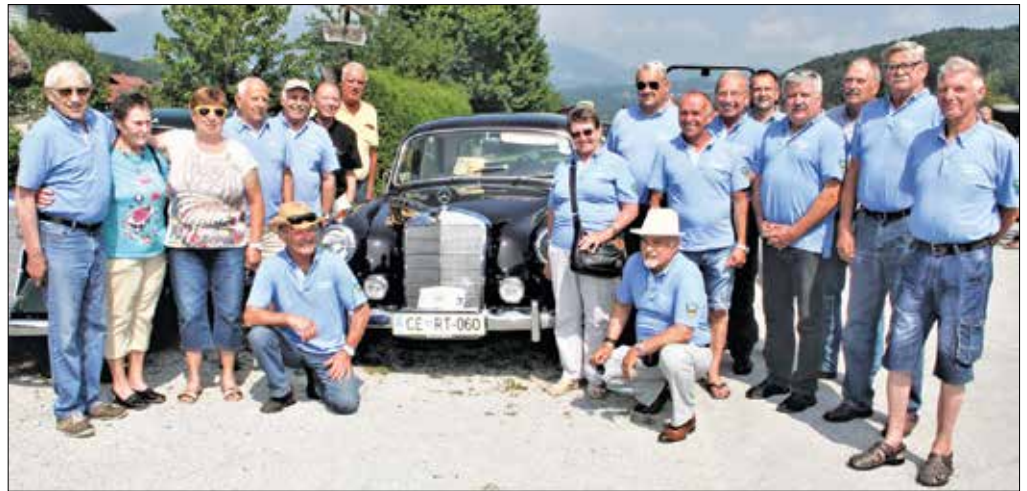
Udeleženci srečanja iz naše doline ob mercedesu starodobniku