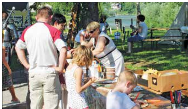
Člani Turističnega društva Nazarje so v srednjeveški vasi pripravili otroške delavnice.