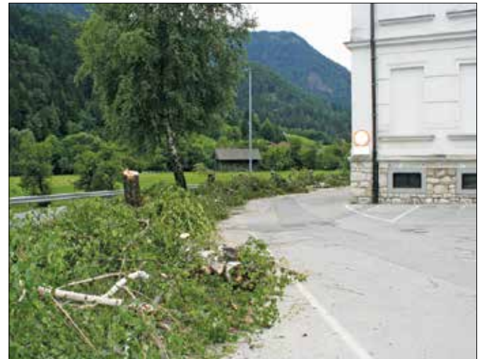
Zaradi posodobitve okolice šole je bilo potrebno odstraniti tamkajšnje breze.

V času letošnjih počitnic se je Občina Gornji Grad kot investitorica odločila za prenovo okolice Osnovne šole Frana Kocbeka, lekarne in zdravstvenega doma. Za dela so objavili javni razpis, na katerega sta prispeli dve ponudbi. Ugodnejša je bila ponudba podjetja Karbon iz Velenja, ki je že začel z deli.