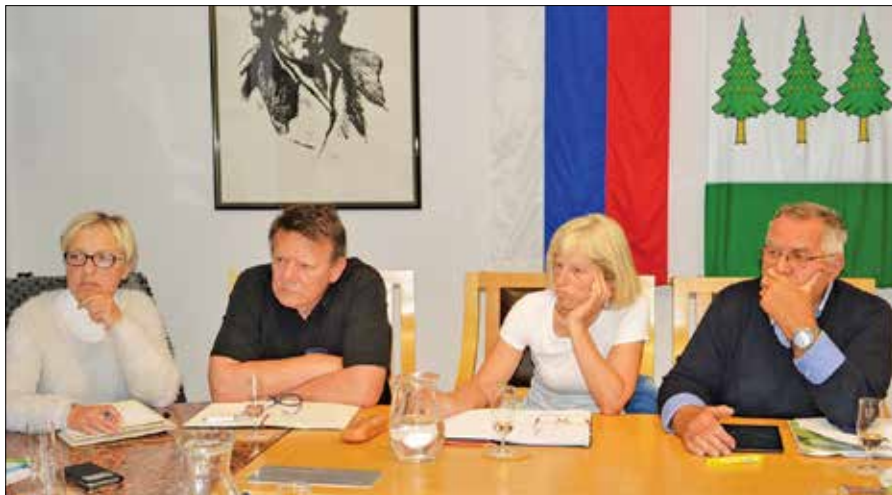
V Civilni iniciativi za ohranitev zdravja Zgornjesavinjčanov ugotavljajo, da glede večine zahtev nimajo informacij s strani sveta zavoda, županov ali vodstva zavoda.

Sestre so v ambulantah vsak dan v rednem delovnem času ambulate. Paciente prosijo za strpnost in razumevanje, saj imajo obilo telefonskih klicev. Prav tako se v tem času, zara-