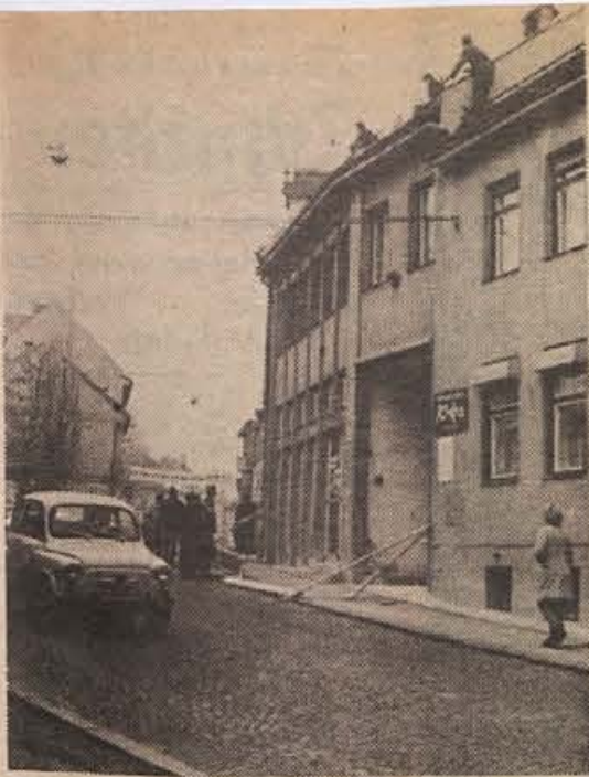
Takole pa ne gre: pločnik zaprt, pešci na cesti in dvojna nevarnost — lahko prileti opeka na glavo ali pa te povozijo avtomobil. Na sliki: pred ekspozi-turo DBH na Cesti komandanta Staneta v Novem mestu.