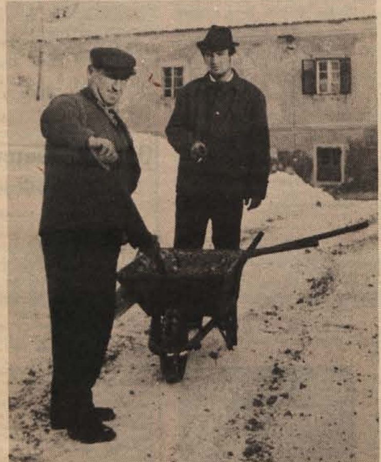
Čprav se je okoli novega leta sneg večkrat ponujal, ni napravil večje zmede. Kljub vsemu pa so delavci novomeškega Komunalnega podjetja skrbno posipavali spolzka mesta, tako da ni prišlo do nesreč.