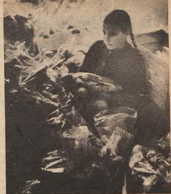
V skladišču dedka Mraza na Vinici, preden je napočil veliki trenutek, ki so ga otroci težko čakali vse leto. Dedek Mraz je letos manjšim šolarjem in predšolskim otrokom z viniškega konca prinesel samo sladkarije. Vedel je, da se jih bo marsikateri otrok samo tokrat najedel.