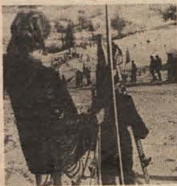
PO KAKŠNIH CENAH LETOVANJA?

Ce so pred tedni gostinske in turistične organizacije ugibale, kako naj sestavijo svoje cenike, da bodo kar najmanj prizadete zaradi različnih tokov posameznih nacionalnih valut, imajo zdaj čisto druge težave. Njihovi ceniki, pa naj bodo natisnjene cene v dolarjih ali dinarjih, so že objavljeni, dinar pa je v tem času doživel svoj drugi padeč v letu 1971. Mimo tega je zvezna vlada sklenila zamrzniti vse cene, ki so veljale 26. novembra. Gostinci in turistične organizacije so se tako znašli v dokaj težkem položaju. Upravni organ turističnih organizacij in Jugohotela je sicer v Beogradu sklenil, da cene penzijskih storitev ne smejo biti večje kot lani v enakih mesecih.