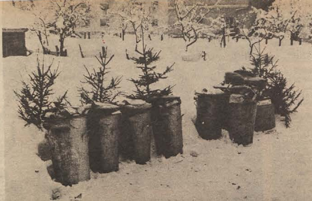
Vesolja je konec. Spet bo treba leto dni pridno delati.