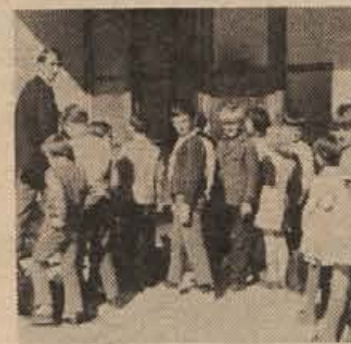
Kritika enotnega učnega načrta. Na sliki: šentjanski šolarji

„Poglejmo samo referendum za razširjeno kmetijsko zavarovanje in spoznali bomo, da je po stopnicah solidarnosti možno uresničiti velike načrte. Dodatni izdatki delovnih organizacij in občin res predstavljajo veliko vsoto (8,4 milijona din), za posamezna podjetja pa ne. V novo-mški regiji predlagajo za prihodnje leto 9,05 odst. prispevka za zdravstveno zavarovanje, v celjski pa stopnjo 9,37. Pri nas je prispevek manjši, čeravno vključuje razen razširjenega kmetijskega zavarovanja še delež (0,4 odst.) za investicije v pokrajini in delež (0,1 odst.) za graditev kliničnega centra v Ljubljani. Solidarnost se nam torej dobro obrestuje.“