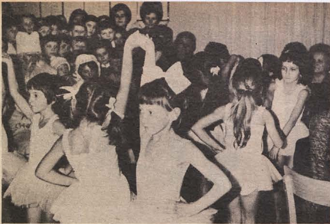
„BALET V BREŽIŠKI GLASBENI ŠOLI“ – Ob koncu starega leta se je dedek Mrz ustavil tudi v brežiški glasbeni šoli; mlade baletke pa so se predstavile s prikupnim baletnim nastopom.