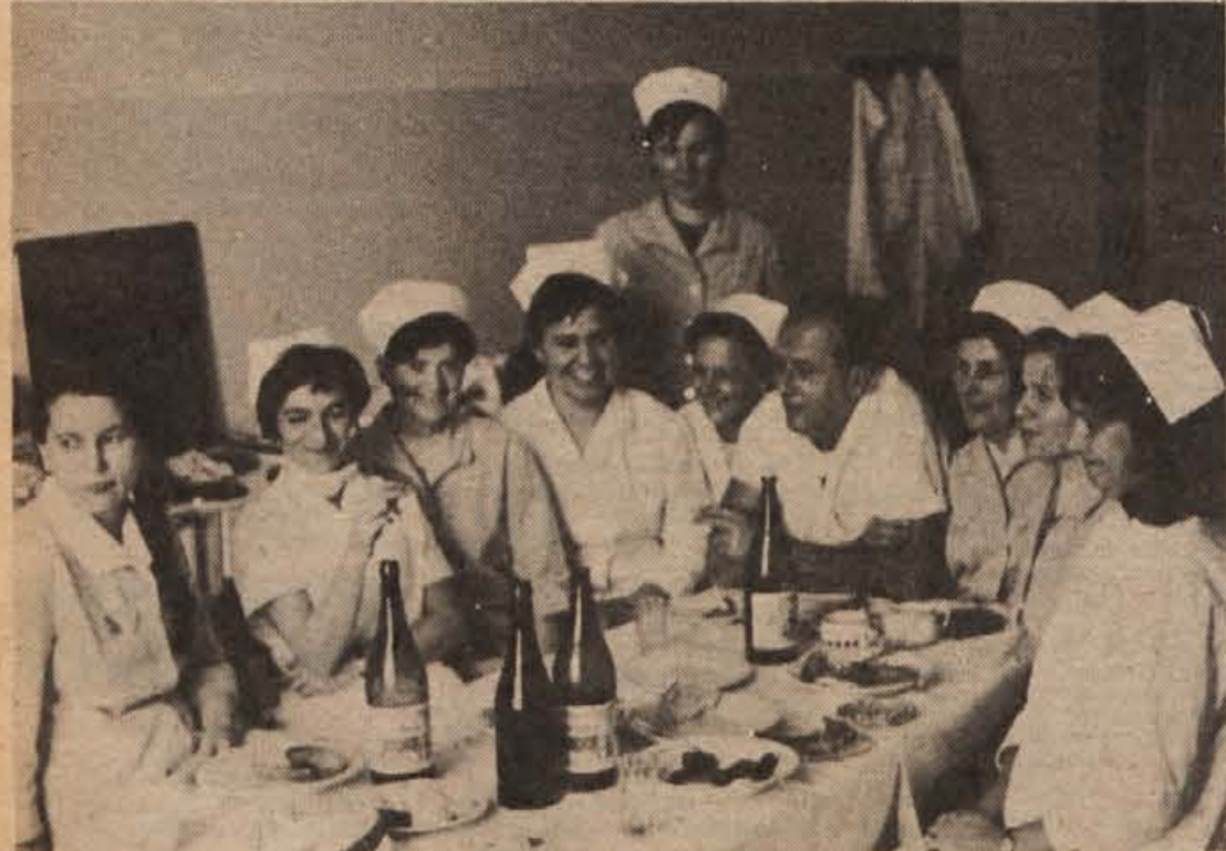
Medtem ko so se nekateri veselili, so drugi delali. V novomeški porodnišnici so dežurni takrat, ko ni bilo dela, v čajni kuhinji tudi silvestrovali.