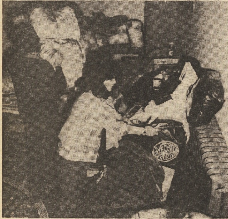
Zbiranje in sortiranje blaga za prizadete po potresu v slovenskem dijaškem domu v Trstu

Mnogo je bilo že povedanega o tem, da so najhujše razrušenosti utrpele kraje severno in severozahodno od Vidma ob podvznožju karinskih in beneških hribov. Humin, Majano, Buja, Osopu in druga mesteca, vasi in zaselki so praktično zrnani z zemljo. Kar še stoji, so le okostja hiš, ki se turbotno dvigajo iznad ruševin. Mrtvih je bilo v teh krajih največ, škoda nedvomno največja in tudi pomoč — čeprav ne dovolj hitra — je prav v te kraje prišla prva. Časniki in radio, televizija in agencije so prav njim na-