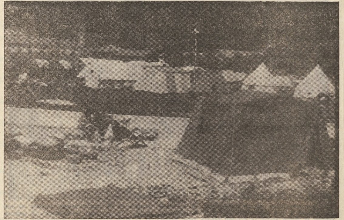
Potres je 6. maja občutno prizadel tudi obsoke predele v sosedni Sloveniji. Na sliki del šotorišča, ki so ga za prizadeto prebivalstvo postavili pri Kobaridu.