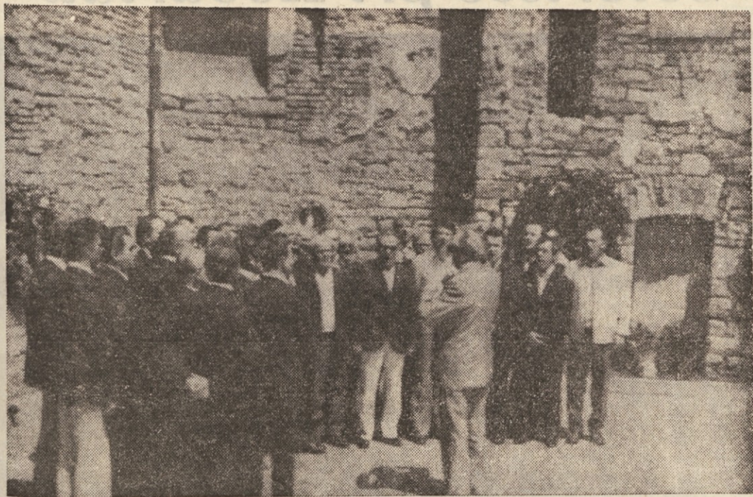
Članj pevskega zbora «Zarja» iz Trbovelj, ki so sinoči nastopili na Opčinah so včeraj dopoldne ob svojem prihodu v Trst najprej obiskali Rižarno v spremstvu predstavnikov pevskega zbora «Tabor». S pesmijo, vencesim in šopom cvetja so počastili spomin žrtve Rižarne, ki so si jo nato z velikim zanimanjem ogledali.