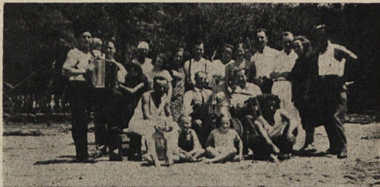
11 februarja so se zbrali štajerci v Villa Dominico; kot kaže slika so bili prav židane volje.