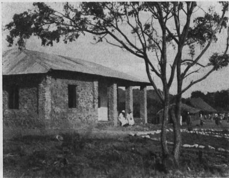
Katoliški misijon Bagamoyo. Zadaj zamorske kočee.

pokazal pravo pot, ker k Bogu bi bil rad prišel — tako je rekel.