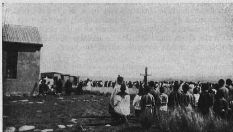
Procesija bolnikov prejme blagoslov z Najsvetejšim.