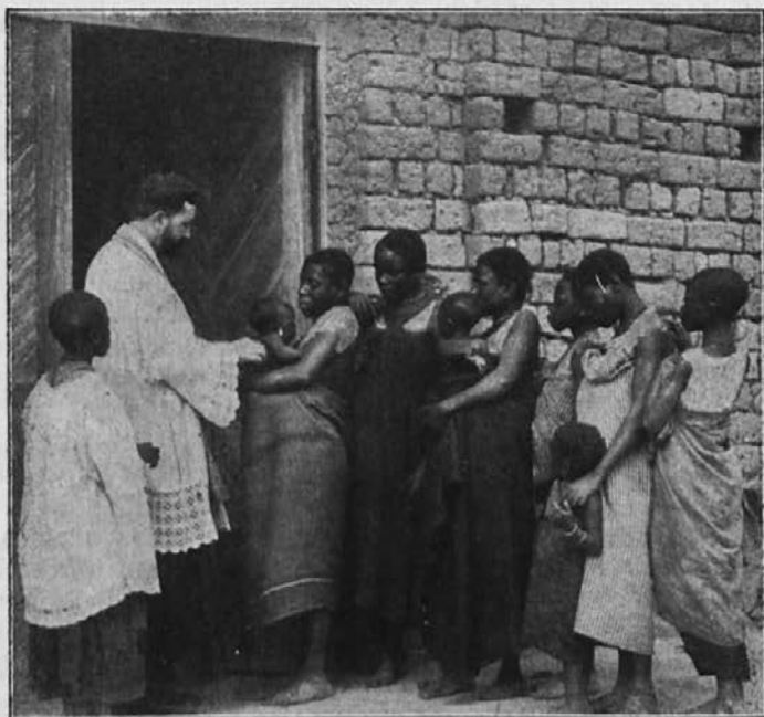
Zene so prinesle zamorčke k sv. krstu.

v misijonu napravili rakev in da bi prišel jutri kdo z vozom po mrliča. Obljubili smo in mladenič se odpravi zopet domov.