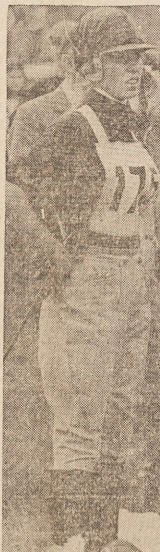
VESELJE DO KONJ — Britanska princesa Ana je navdušena jahatnica in utegne biti v zastopstvu Velike Britanije na olimpijskih igrah v Muenchenu prihodnje leto.