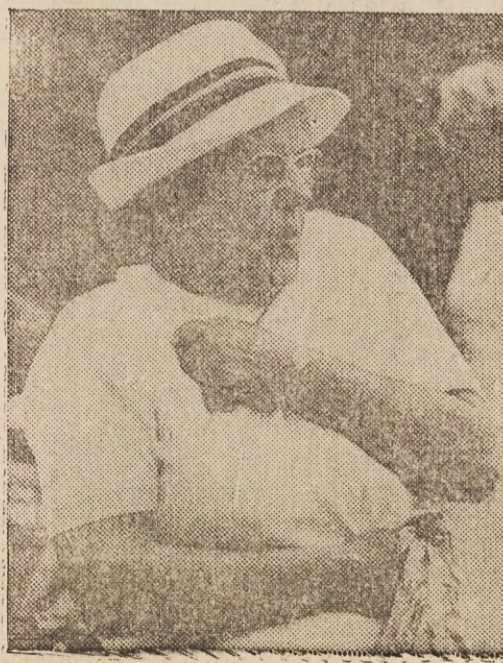
PO ANGLESKO — Opazovalki na levi najbrž ni prav nič všeč igranje njene tovarišice, ki bi rada kar z roko od daleč prepekljala svojo kroglo do cilja. Sliki sta bili posneti na narodnem balinarskem prvenstvu v Wimbledonu parku na Angleškem.

Kadar kupujete ali prodajate hišo, farmo ali lot, kličite nas, staro zanesljivo agencijo. Dajemo tudi brezplačne nasvete in posredujemo solidne stanovalce! KNIFIC REALTY 481-9980 820 E. 185 St. (xw)