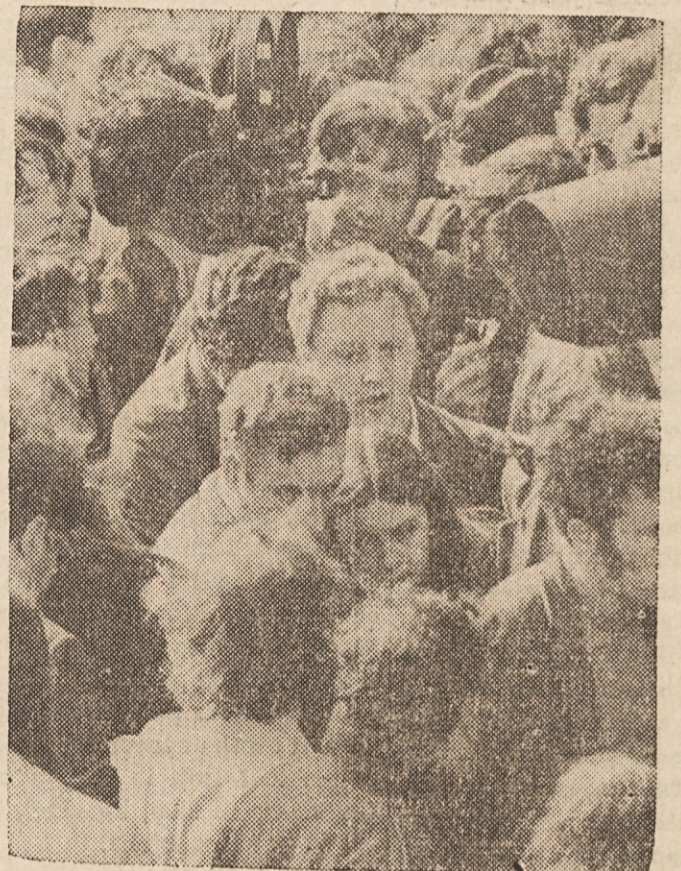
NEMIRNA SEVERNA IRSKA — Slika kaže skupino demonstrantov v Londonderryju v Severni Irski z Bernadette Devlin, zvezno poslanko v sredi (spredaj).