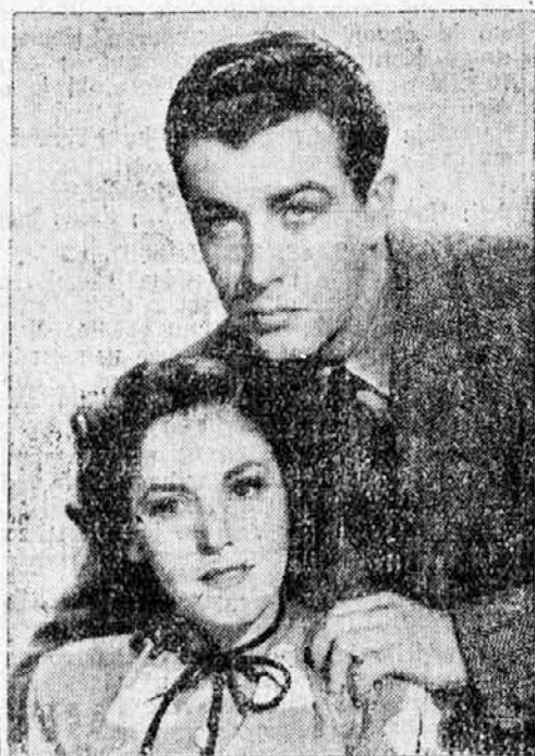
ROBERT TYLOR IN MAUREEN O' SULLIVAN

Za nas je Charlie Chaplin večno mlad, v resnici pa je že osivel starček. Chaplinov sin iz prvega zakona je star že 20 let, kljub temu pa je stari še vedno navdušen za film.