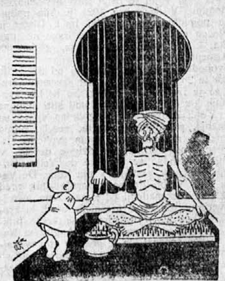
Fakir uči že zgodaj svojega sinčka...

Majhnim otrokom ne bi smeli pred velikim mesecem dajati jaje. Šele z desetim mesecem bi lahko storili prve poskuse, tako da bi otroku najprej dali polovico rumenjaka, zmešanega z mlekom ali z juho. Če bi prvi poskus uspel, potem damo lahko otroku ves rumenjak in mu postopoma dodajamo še beljak. Otroci izpod dveh let ne bi smeli pojedsti na dan več kot eno jajce.