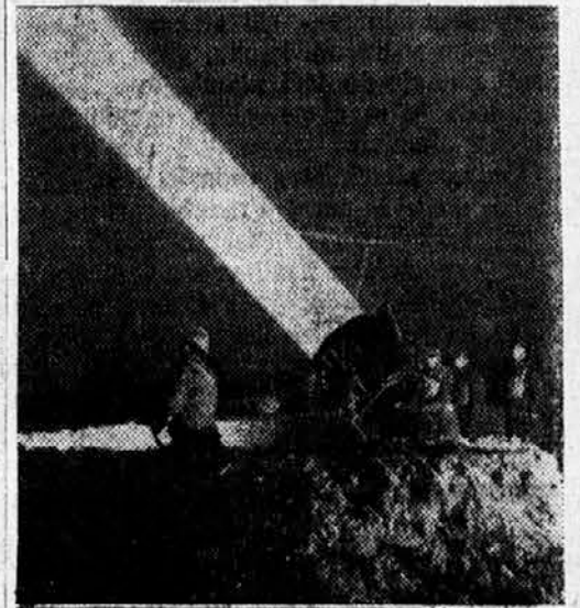
Močan reflektor nočne stražne službe proti letalom na francoskem bojišču

V Ameriki obstaja posebno društvo za zaščito visokoraslih ljudi. Društvo ima nalogo, skrbeti za udobnost dolginov kjerkoli v življenju. Uspelo mu je, da so trgovci dvignili pri izložbah prenzko nastavljene senčnike, zdaj je pa na njegovo željo preuredil neki hotel v New Yorku svoje naprave za visoke ljudi, zato je vse ovire odstranil. Zdaj bo imel gotovo dosti gostov in ostali hoteli mu bodo morali slediti, če se bodo hoteli izogniti prehudi konkurenci.