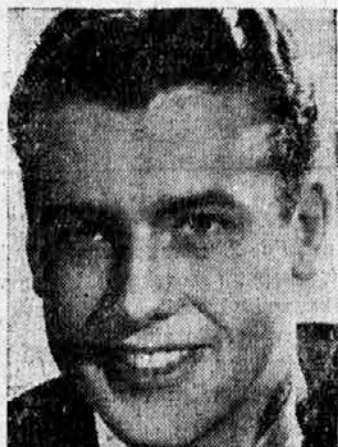
RICHARD GREENE (MGM)

Algefa Film iz Berlina je izvršil julija snimanje zunanjih scen za film »Poročno potovanje brez moza«. Snimanje je bilo v Dubrovniku.