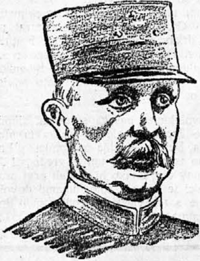
Maršal PETAIN, branilec Verduna

Zunaj trdnjav pa 700.000 mrtvih, 700 tisoč borcev, ki počivajo v zemlji, preprepojeni s krvjo. Ali bodo našli mir še dolgo, ali se bodo spet odprle poljane pred ključem Francije, Verdunom...?