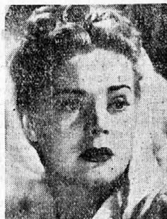
ALICE FAYE — ZENA Z NAJLEPSIMI OČMI (MGM)

Število kinematografov v naši državi je lani ponovno naraslo. Leta 1933 je bilo v vsej državi 174 zvočnih kinematografov, predlanskim je to število naraslo na 357, lani pa na 397; od tega je bilo v donavski banovini 114 (prejšnje leto 93), v savski 80 (76), v dravski 63 (58), v moravski 27 (24), v vardarski 23 (23), v drinski 21 (18), v primorski 16