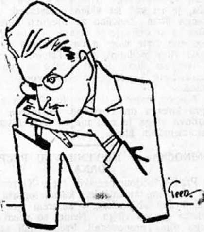
77. Pruska igra

Radovednemu šahistu za povrh še eno izmed najboljših Pirčevih partij, krasno zmago nad Spielmannom v turnirju v Noordwijku.