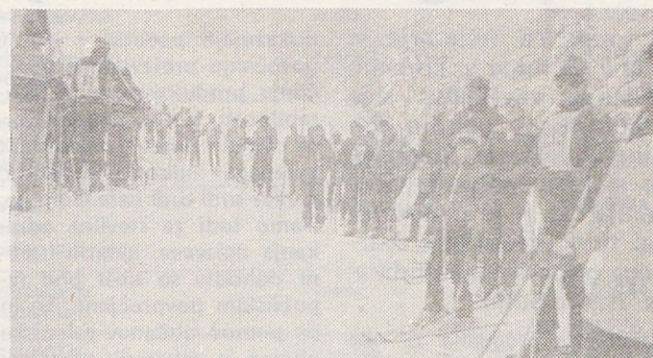
Kljub snegu, pozni uri in megli je tudi naš posnetek z veleslalomom uspel

Preloženi veleslalom za ekipno prvenstvo Gorenja in za pokal Gorenja je lepo uspel. Kljub pozni uri, sneženju in megli, je bilo tekmovalno vzdušje pravo, pripravljenost velika, velika pa tudi borbenost, kar so premnogi plačali s pristankom v snegu med modrimi in rdečimi vratci. Seveda pa tudi na cilju ni manjkalo presežne organizatorji so se res potrudili, z njimi vred pa tudi privrženci belega športa, ki jih je v naših vrstah vse več.