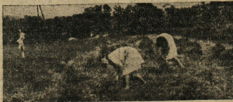
Kdor seje — ta žanje!

Dobro so sestavili proračune oni KLO-ji, ki so vsa navodila vzeli resno, za vse nejasnosti pa zahtevali pojasnila in ki so imeli v redu svoje blagajniške knjige in kontrolne kredite, ki so pravočasno dostavljali odseku računsko in proračunsko podatke in poročila. Ne morajo pa biti dobri proračuni onih KLO-jev, ki še do danes niso dostavili finančnemu odseku proračunskih podatkov, in jih je moral odsek sam ugotavljati. Takih KLO-jev je v okraju 24, od katerih res ne moremo pohvaliti posebno sle-