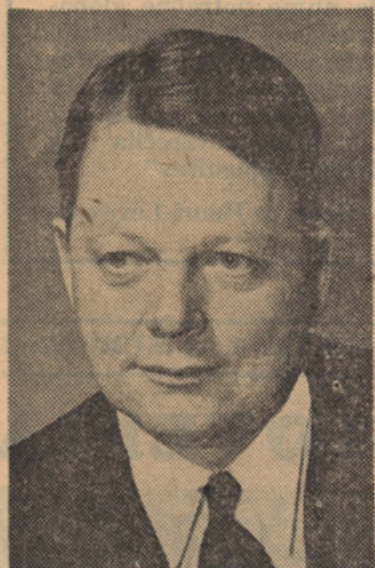
J. W. PICKERSGRILL Minister za državljanstvo in vseljevanje

Otroci novonaseljencev v Kanadi, ki so se rodili izven Kanade, niso upravičeni do otroških dokladov za dobo enega leta po priselitvi v Kanado.