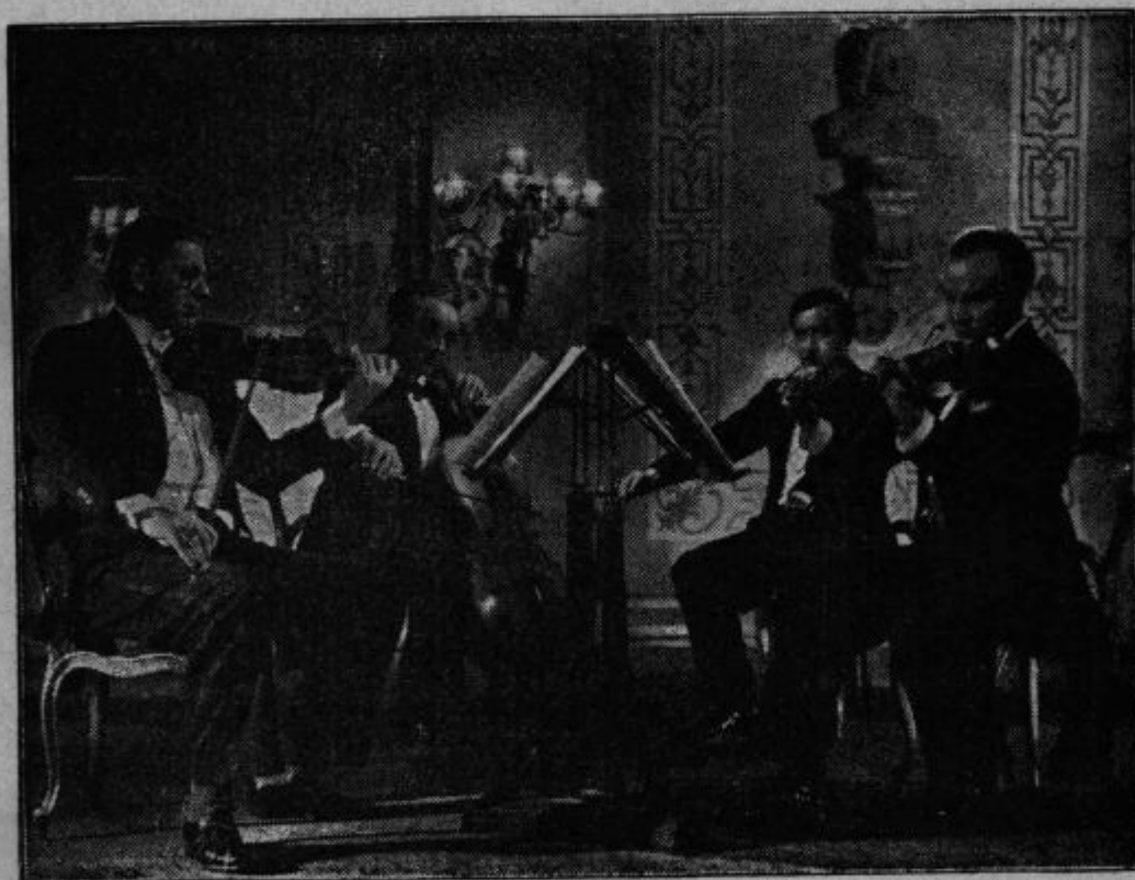
Sloviti Lohner-kvartet iz filma »Serenada« (Kino Union, Ljubljana)