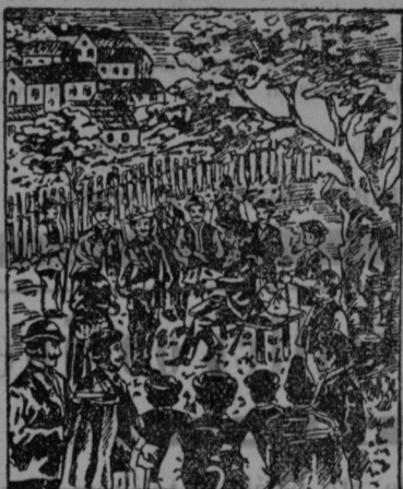
Vidmaric kaže kmetom „moč Pšakrakih kapljic“ in „Slavonske zeli“.

Cena je sledeča (franko na vsako pošto): 12 stekleničic (1 ducat) 5 K, 24 stekleničic (2 ducata) 8 K 60 v, 36 stekleničic (3 ducati) 12 K 40 v, 48 stekleničic (4 ducati) 16 K, 60 stekleničic (5 ducatov) 18 K. Manj od 12 stekleničic se ne razpošilja.